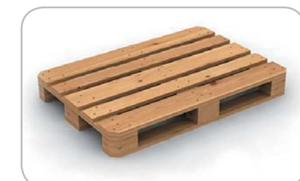
... o fino a 3 Europallet