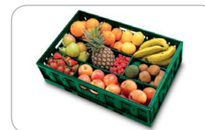
Fino a 33 cassette di frutta...