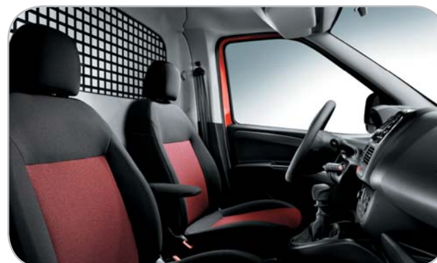
TESSUTO ROSSO 110