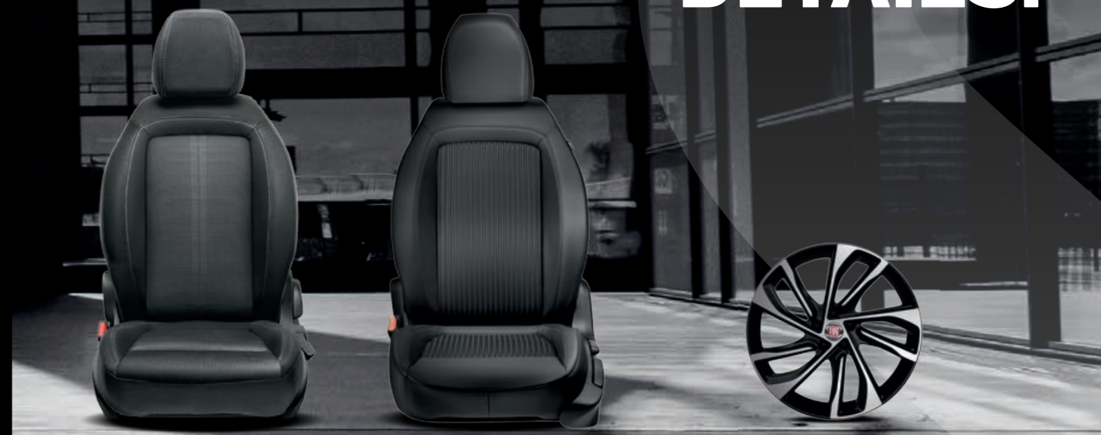
025 - SELLERIE NOIR/GRIS AVEC DOUBLE SURPIQÛRE (DE SÉRIE)