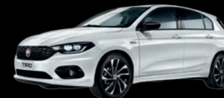
249 - BLANC GELATO - PASTEL EXTRA-SÉRIE