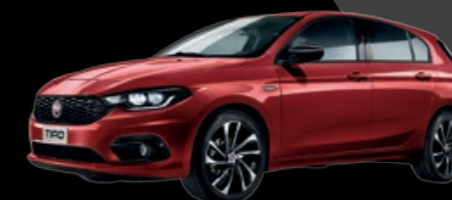
716 - ROUGE AMORE - MÉTALLISÉE