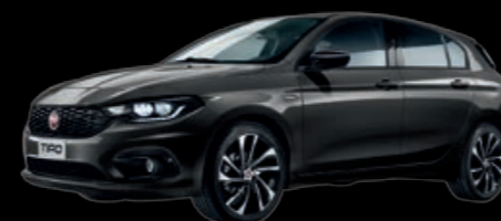
718 - NOIR CINÉMA - MÉTALLISÉE