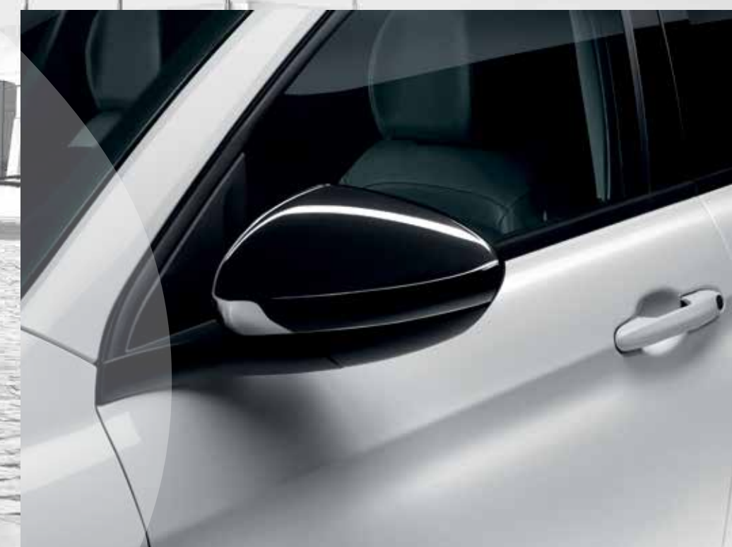
FINITIONS NOIR LAQUÉ