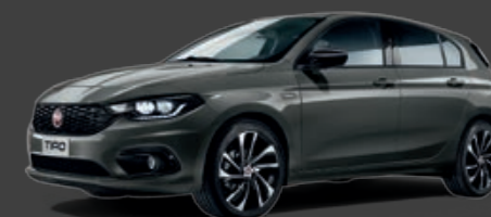
695 - GRIS COLOSSEO - MÉTALLISÉE