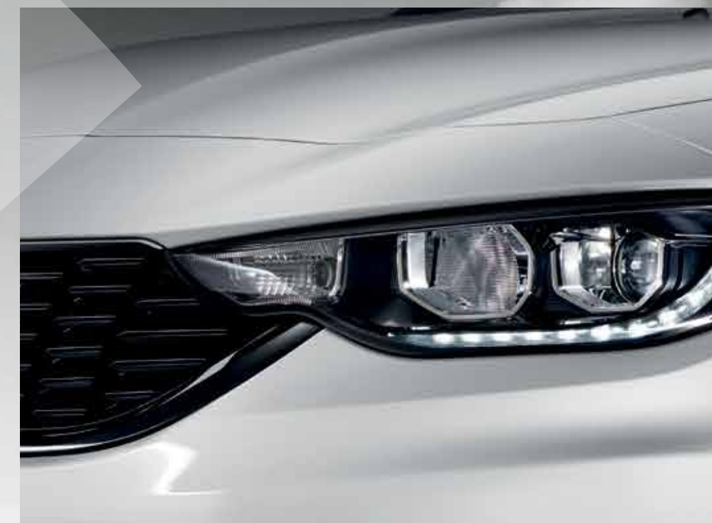
PROJECTEURS AVANT BI-XÉNON (OPTION)