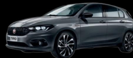
793 - NOUVEAU GRIS METROPOLI - PASTEL EXTRA-SÉRIE