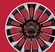
Jantes alliage 17"