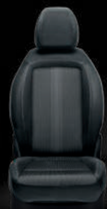
Tela Skyline negra/gris con costuras dobles