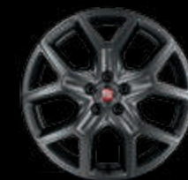
Llantas de aleación de 43 cm (17") gris mate