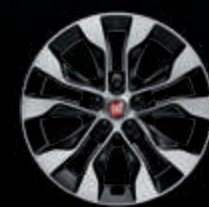
Llantas de aleación diamantadas de 40 cm (16")