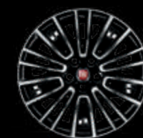
Llantas estilizadas de 40 cm (16")