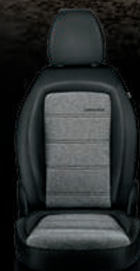
Tela tipo melange con inserciones de vinilo y costuras dobles