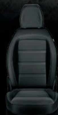
Tela con inserciones negras y costuras dobles