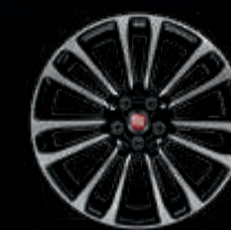
Llantas de aleación diamantadas de 43 cm (17")