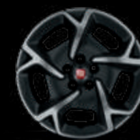
Llantas estilizadas de 40 cm (16") negro mate