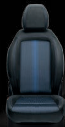
Tela Skyline negra/azul con costuras dobles