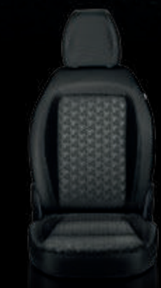
Tela negra con diseño 3D y costuras dobles