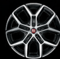
Llantas de aleación diamantadas de 43 cm (17") negro mate