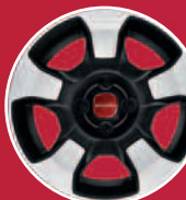
Jantes acier 15"