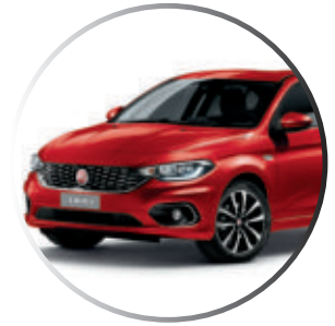
168 Rouge Passione (1) Peinture Pastel