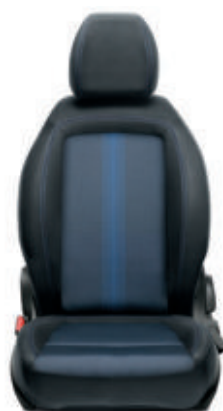
MIRROR Tissu Skyline noir/bleu 049