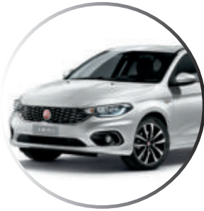
249 Blanc Gelato (1) Peinture pastel