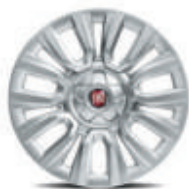
Enjoliveurs 15" De série sur Tipo