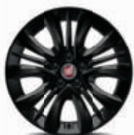
Jantes alliage 16" noires De série sur Street