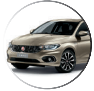
722 Perle Sabbia Peinture métallisée