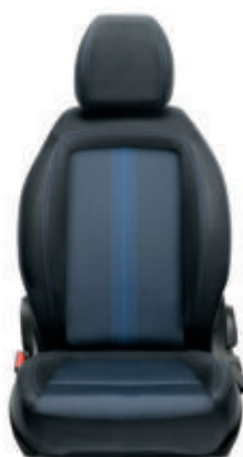
MIRROR Tissu Skyline noir/bleu 049