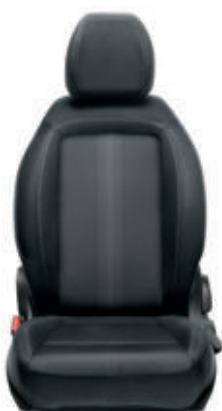
MIRROR Tissu Skyline noir/gris 519