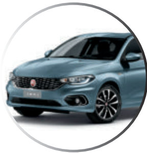
448 Bleu Canalgrande (2) Peinture métallisée