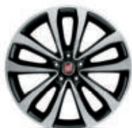
Jantes alliage bicolores 17"

(1) Sur Lounge et cuir + tissu Airtex sur S-Design / Sport.