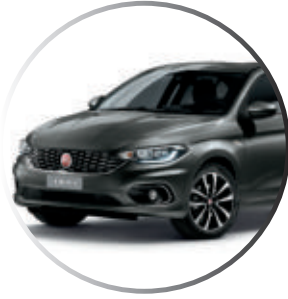
695 Gris Colosseo Peinture métallisée