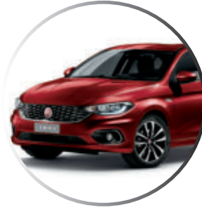
716 Rouge Amore Peinture métallisée