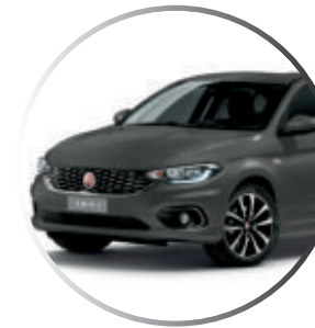
706 Gris mat (1) Peinture mate