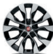
Jantes alliage bicolores 16" De série sur Mirror