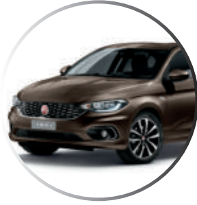
444 Bronze Magnetico Peinture métallisée