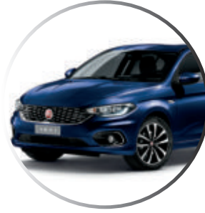
717 Bleu Mediterraneo Peinture métallisée