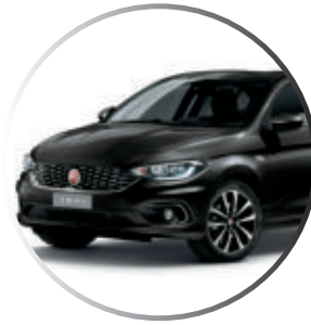
718 Noir Cinema Peinture métallisée