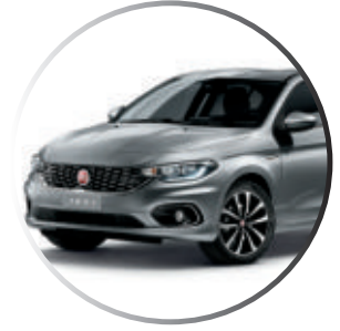
612 Gris Maestro Peinture métallisée