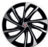
Jantes alliage 18" S-Design