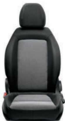
TIPO/STREET Tissu noir/gris 030