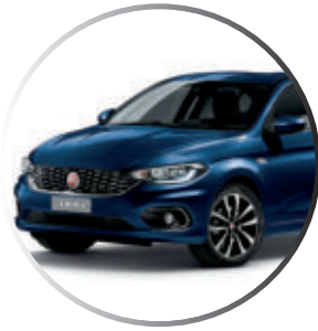
515 Bleu Mirror Peinture métallisée