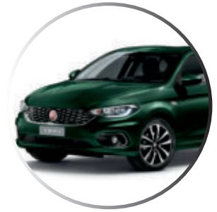
651 Vert Toscana Peinture métallisée