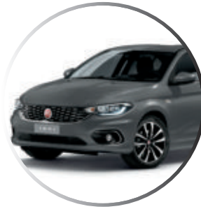
793 Gris Metropolij (1)(3) Peinture Pastel