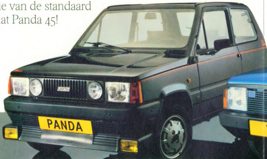
PANDA 45 PRIMA.

De officiële prijs van al deze accessoires bedraagt f 2.313,-. De prijs van de Fiat Panda Prima bedraagt echter maar f 600,- meer dan die van de standaard Fiat Panda 45!