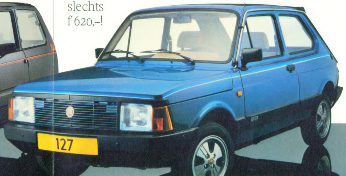
FIAT 127 PRIMA.

Officiële prijs van deze accessoires: f 2.634,-. Meerprijs van de 127 Prima ten opzichte van de standaard 127 Special 3-deurs: slechts f 620,-!