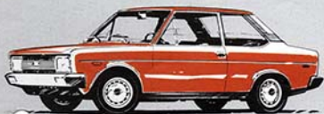
2 porte "1600"

È prodotta in 11 versioni: 2 porte, 4 porte, familiare 5 porte, in allestimento normale e Special, con due tipi di motorizzazione "1300" e "1600". Vasta scelta di optional.