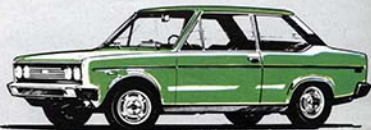
Special 2 porte "1300"