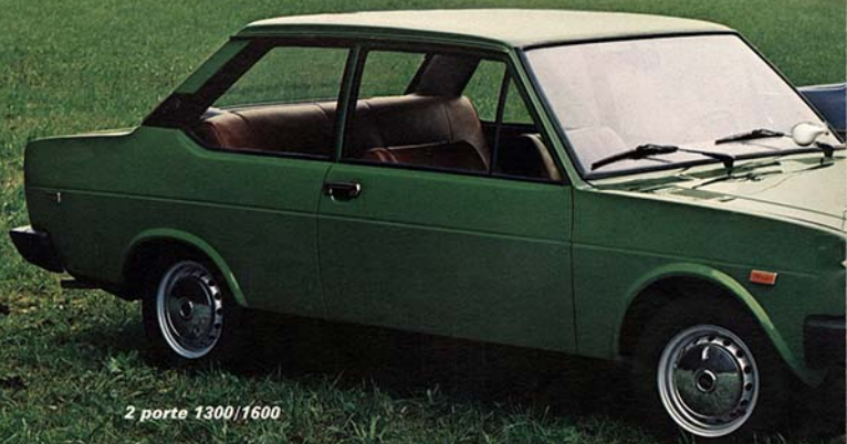
2 porte 1300/1600

bile nel vano motore oltre a facilitare le normali operazioni di manutenzione, rende più semplice e razionale l'installazione di importanti optional come il condizionatore d'aria.