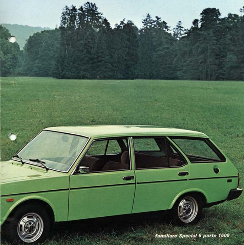
familiare Special 5 porte 1600

La « familiare » versione normale è disponibile sia con motore « 1300 », sia con motore « 1600 ». La « familiare » Special solo con il motore « 1600 ».