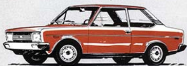
2 porte "1300"