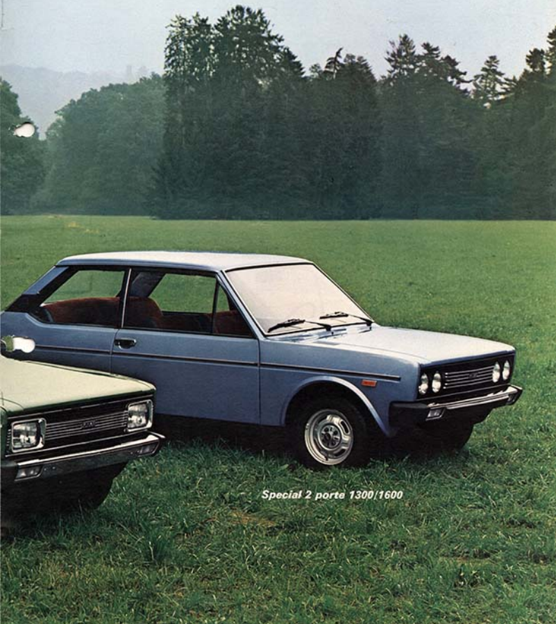
Special 2 porte 1300/1600

filante, quasi quello di un coupé « gran turismo ». Contribuisce a creare questo effetto lo slanciato raccordo dei cristalli posteriori con la grigliatura nera dei montanti (in cui si aprono le feritoie per il deflusso dell'aria interna).