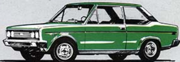
Special 2 porte "1600"