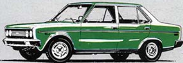
Special 4 porte "1600"