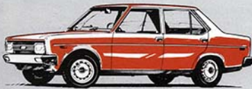
4 porte "1600"