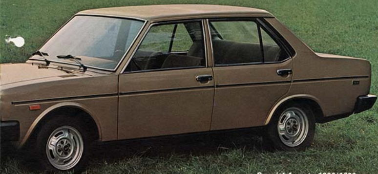
Special 4 porte 1300/1600

nere una grandiosa abitabilità, molto spazio libero nel vano motore, un notevole bagagliaio e una linea d'insieme armoniosa e filante.