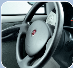
Airbags Fiat® conducteur et passager