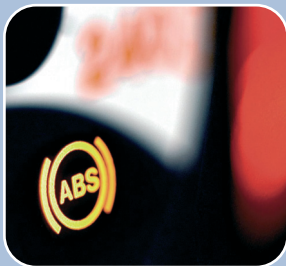
Freinage ABS avec EBD