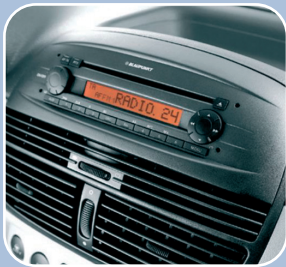
Autoradio CD et 6 HP