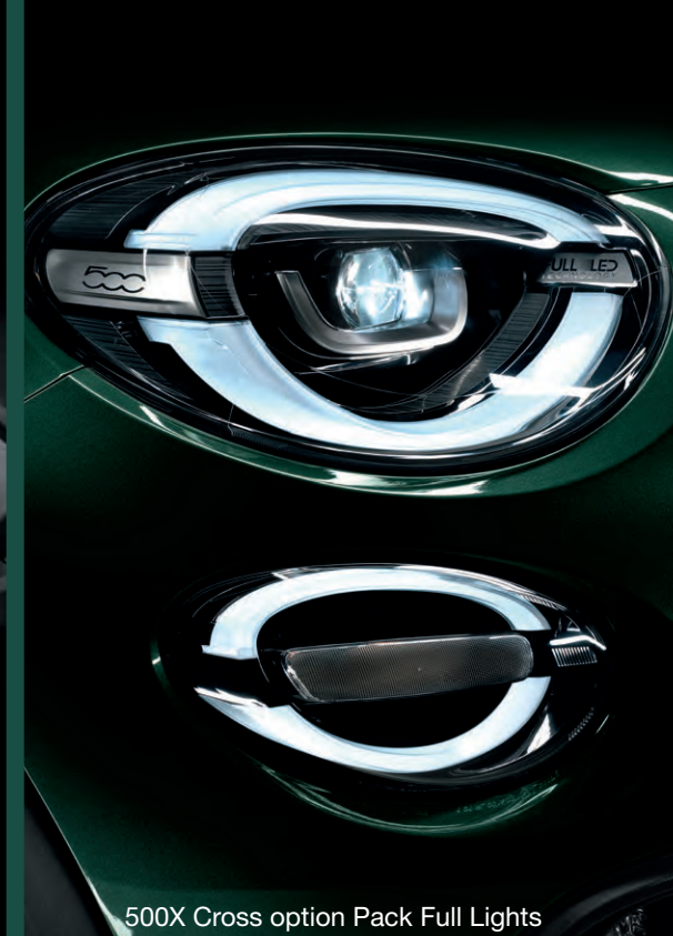
500X Cross option Pack Full Lights