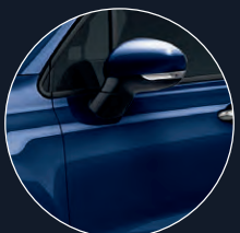
888 BLEU VENEZIA*