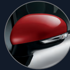
Coques de rétroviseurs (disponibles en rouge - 50903553, blanc - 50903554, bronze - 50903555, gris - 50903556 ou noir - 50927551) 75 €*