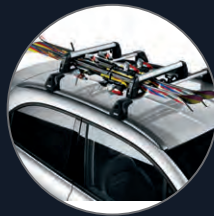
Pack Loisirs Hiver (1) (bac de coffre, barres de toit transversales, porte-skis) 71807442 289 €*