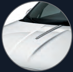
Moulure chromée sur capot 50927458 99 €*