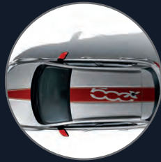
Stickers de toit et de capot (1) (avec logo 500X, disponibles en blanc - 50927499, gris - 50927501 ou noir - 50927500) 149 €*