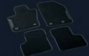
Jeu de 4 tapis de sol en caoutchouc 50290001 59 €*