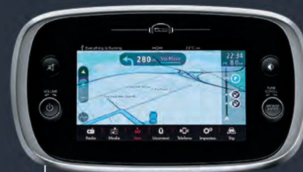
UCONNECT™ 7" HD NAV DAB

Le système Uconnect™ 7", avec Apple CarPlay et Android Auto™ intégrés, est équipé d'un écran tactile 7 pouces haute résolution avec technologie capacitive.