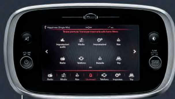
UCONNECT™ 7" HD DAB

Fiat 500X ne manque ni de style, ni de technologies. Boostez votre connectivité grâce au système Uconnect™ avec son écran tactile 7" HD LIVE « effet tablette » offrant de nombreuses fonctions, comme les services Uconnect™ LIVE de série, qui permettent d'être toujours plus connecté, le Bluetooth® qui inclut les appels mains-libres, la lecture des SMS et les commandes vocales (radio, téléphone, fonctions médias). Proposé avec intégration Apple CarPlay et compatibilité Android Auto™, le système est équipé d'une interface intuitive vous permettant de gérer vos cartes, votre musique, vos contacts et bien plus encore. Le tout à portée de main quand vous conduisez, sans compromettre votre sécurité.