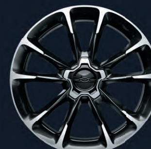
6U4 Jantes en alliage 18" Sport (de série sur Sport)