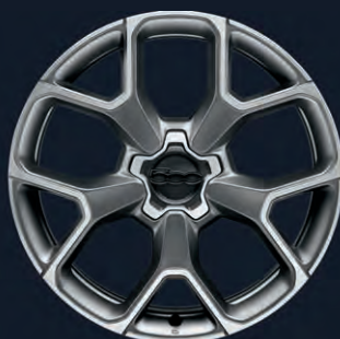
6Y8 Jantes en alliage 19" Sport (en option sur Sport)