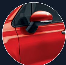
176 ROUGE SPORT*