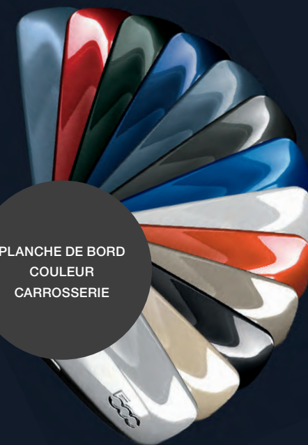
PLANCHE DE BORD COULEUR CARROSSERIE

PLANCHE DE BORD FINITION GRIS TITANE (uniquement sur Sport)