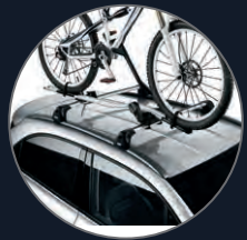
Pack Loisirs Été (1) (bac de coffre, barres de toit transversales, porte-vélos) 71807443 329 €*