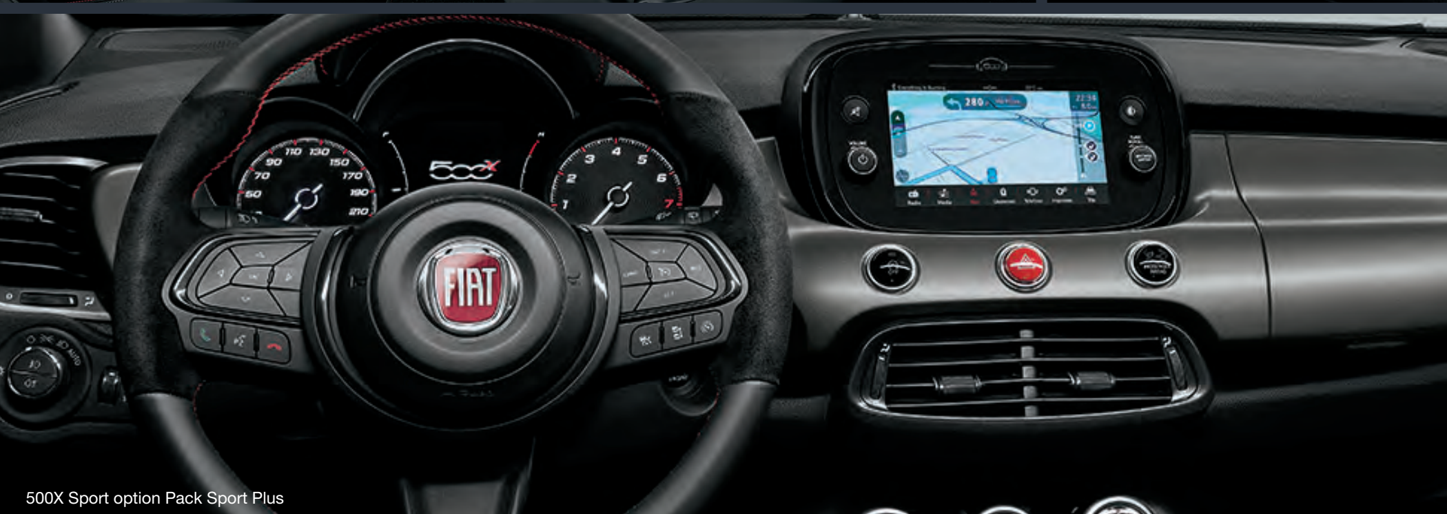
500X Sport option Pack Sport Plus