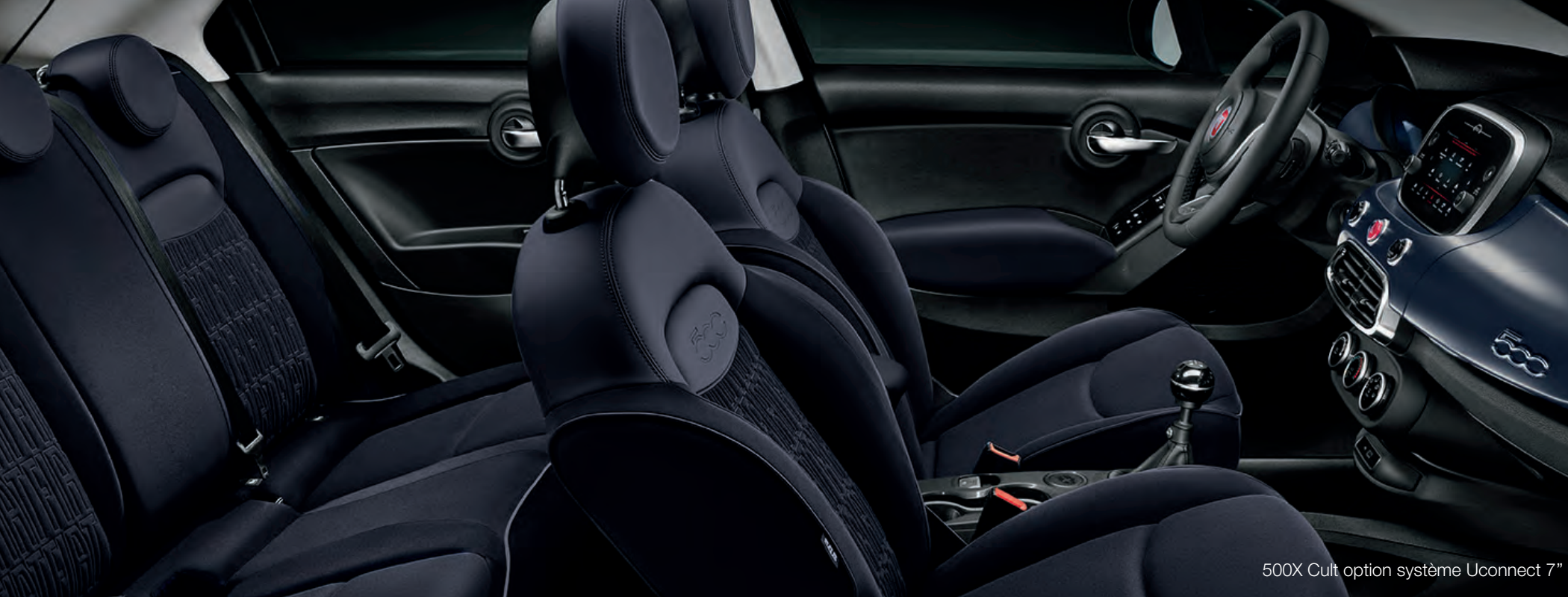
500X Cult option système Uconnect 7"