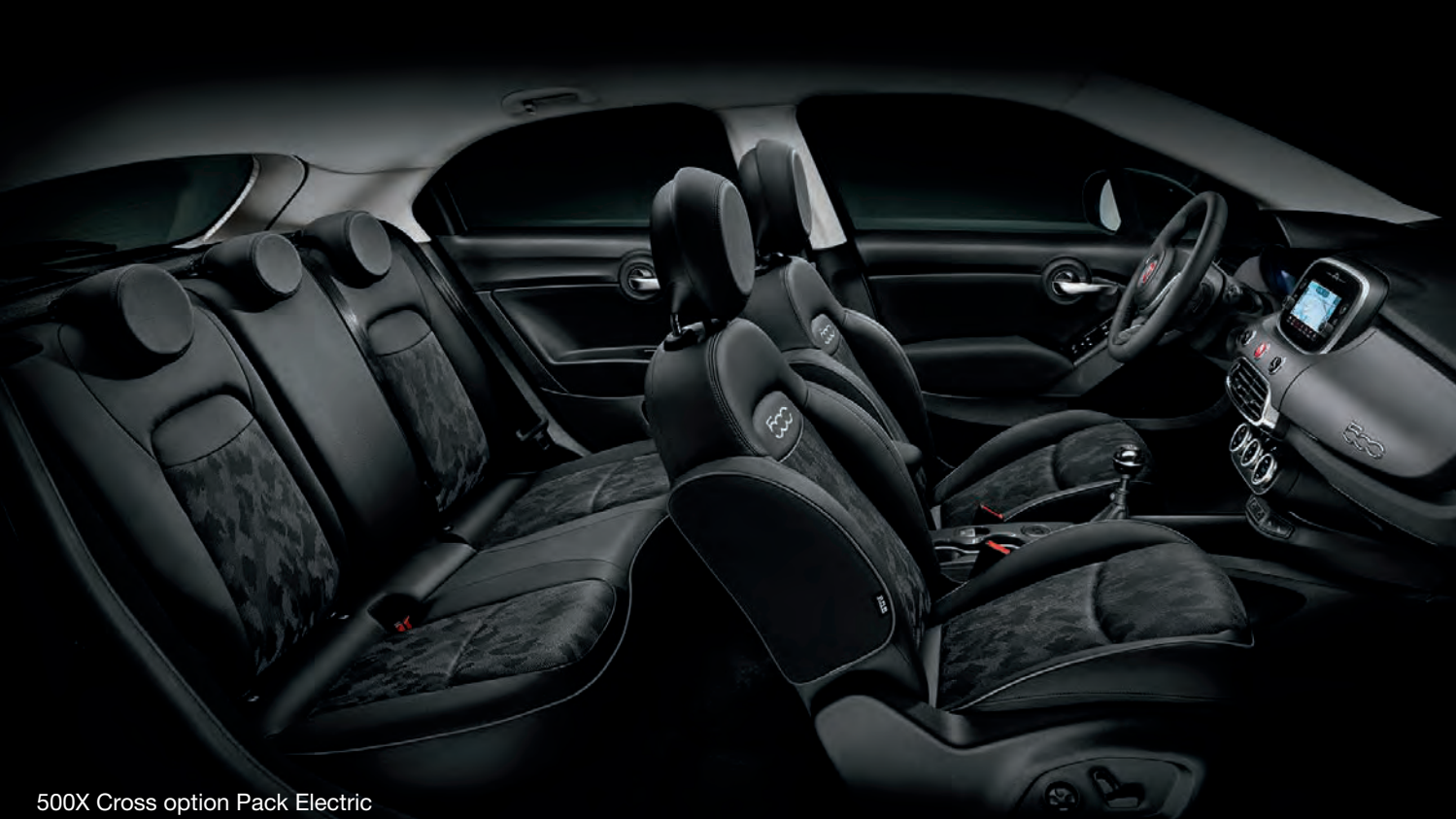
500X Cross option Pack Electric