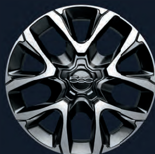
73Z/2KR Jantes en alliage 19" Black Machined (de série sur Club)