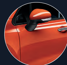
562 ORANGE SICILIA