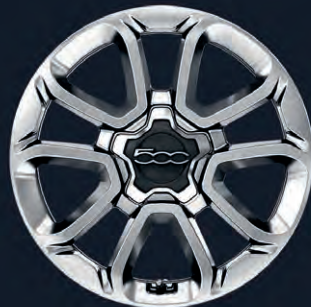
404 Jantes en alliage 16" Argent (en option sur Cult)