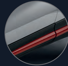
Joncs de portes (disponibles en rouge - 50903548, blanc - 50903549, bronze - 50903550 ou gris - 50903551) 249 €*