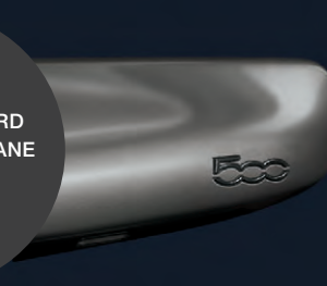
PLANCHE DE BORD FINITION GRIS TITANE (uniquement sur Sport)