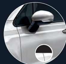
348 GRIS ARGENTO*