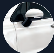
296 BLANC GELATO**