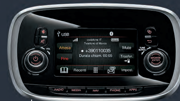
RADIO UCONNECT™ DAB

Le système Uconnect™ 7" HD Nav est doté du navigateur TomTom et de la fonction DAB (Digital Audio Broadcasting). Il est disponible avec intégration Apple CarPlay et compatibilité Android Auto™.