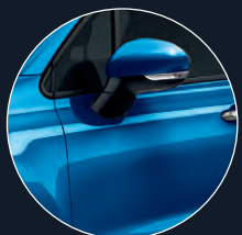
018 BLEU ITALIA*