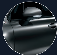
185 GRIS MODA