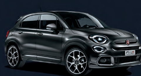
Gris Moda mat