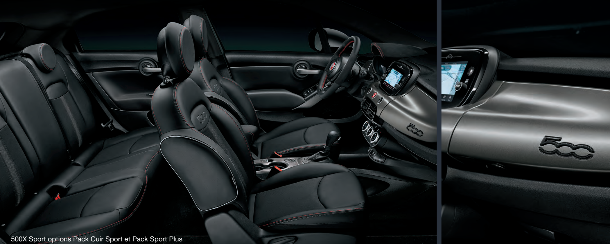
500X Sport options Pack Cuir Sport et Pack Sport Plus