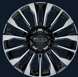
4AV Jantes en alliage 17" Black Machined (de série sur Cross et en option sur Club)