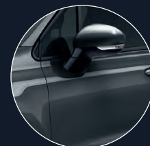
679 GRIS MODA*