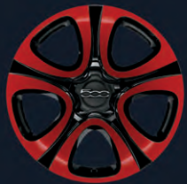
Jantes en alliage 18'' Bi-couleurs Rouge Passione / Noir Cinema 50927533 970 €*