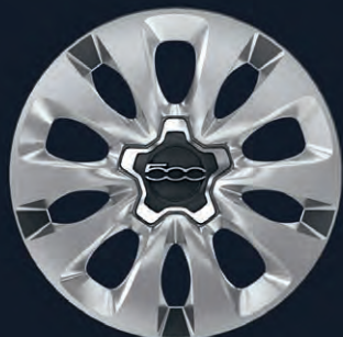
128 Jantes en acier 16"