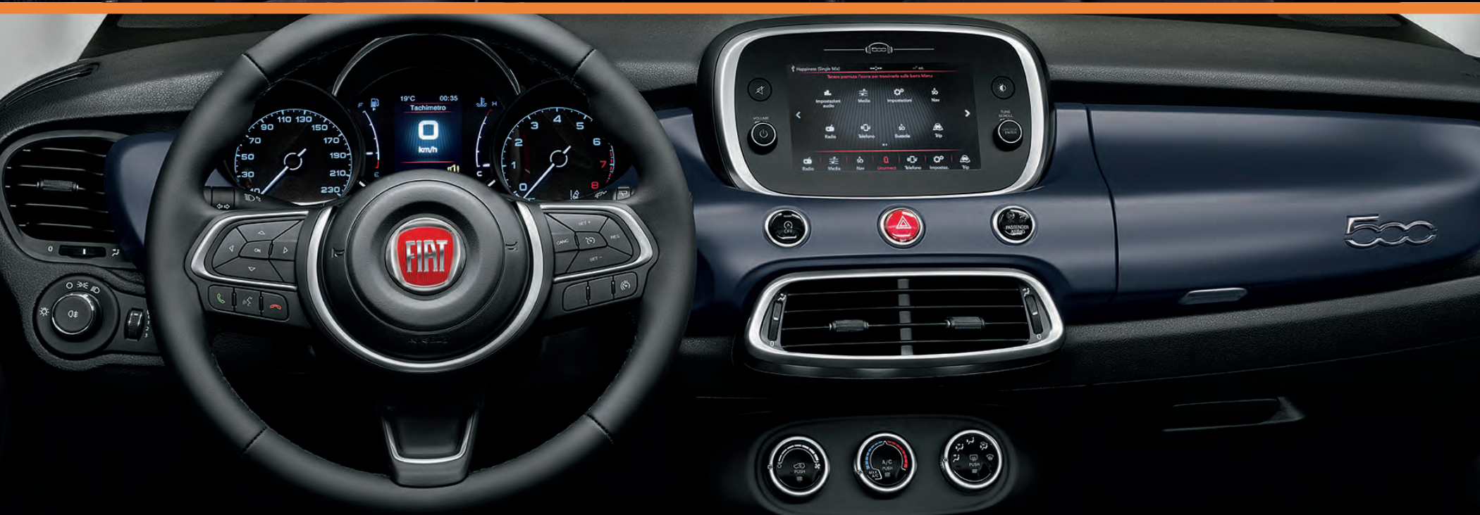
500X Cult option système Uconnect 7"