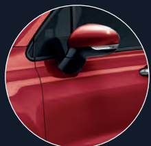
289 ROUGE PASSIONE*