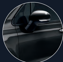
601 NOIR CINEMA