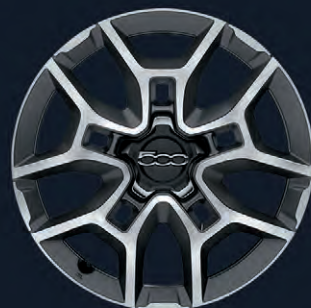
56J Jantes en alliage 18" Black Machined (en option sur Cross)