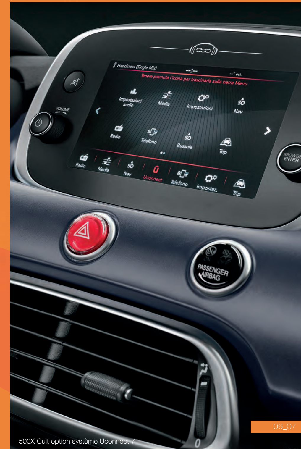
500X Cult option système Uconnect 7"

Climatisation manuelle, avertisseur de franchissement de ligne avec correcteurs, reconnaissance des panneaux de signalisation, régulateur de vitesse, frein de stationnement électrique... Son crédo : transformer chaque trajet du quotidien en un moment exceptionnel.