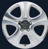
Jantes en alliage 18'' Diamantées Blanc 51993394 910 €*