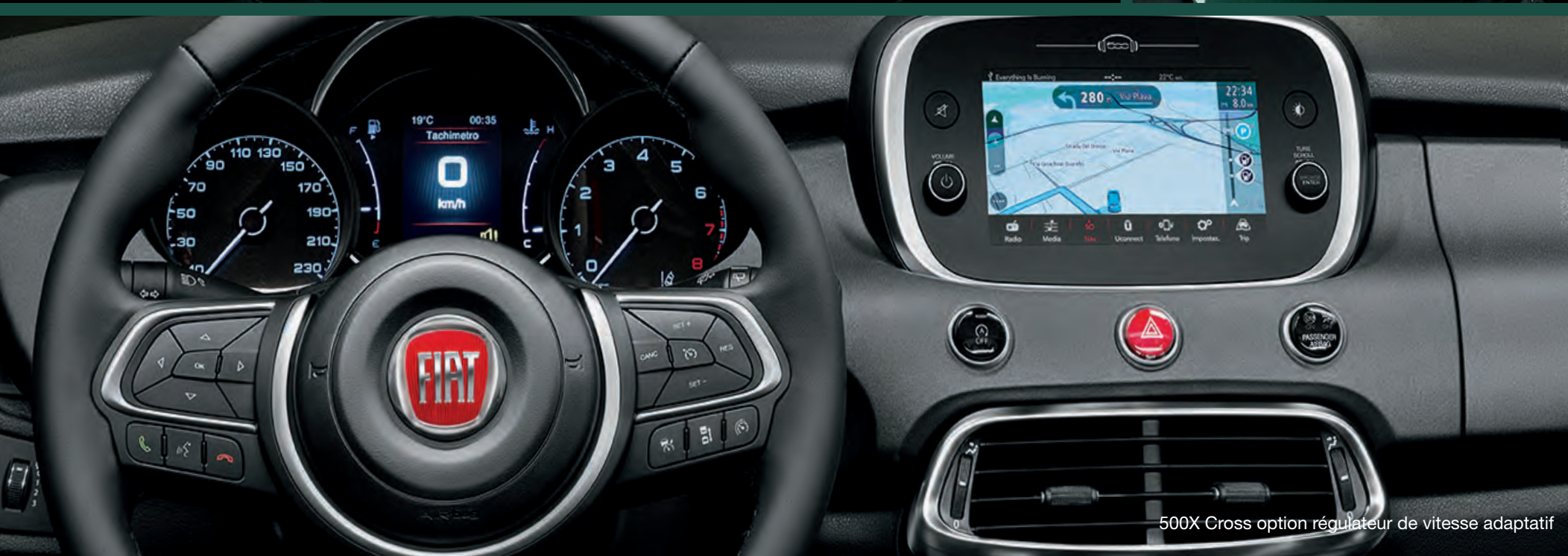
500X Cross option régulateur de vitesse adaptatif