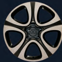
Jantes en alliage 18'' Bi-couleurs Gris Arte / Bronze Magnetico Mat 50927534 970 €*