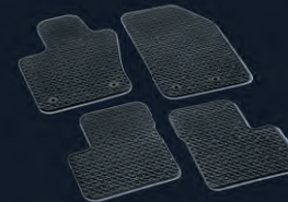
Jeu de 4 tapis de sol textile premium 50928997 59 €*