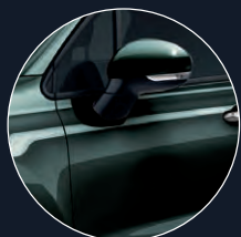
019 VERT TECHNO*