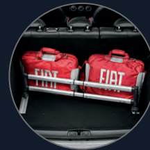
Composé d'une plate-forme, de 2 adaptateurs et d'un bras télescopique 50927543 439 €*