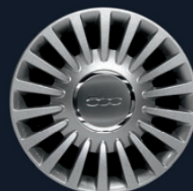
Jantes en alliage 15" Multispoke 71803943 - 749 €*