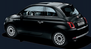
876 Crossover Black