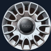
Jantes alliage 15" Original 50901665 - 749 €*