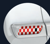
Damier rouge** 50901998 - 65 €*