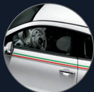
Stickers latéraux drapeau italien 50901914 - 179 €*