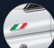
Badges drapeau italien sur ailes avant 50901681 - 45 €*