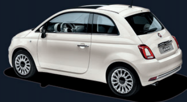
268 Bossanova White