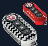
KIT DE 2 COQUES DE CLÉS : Chevron et Coral red. 50927692 - 42 €