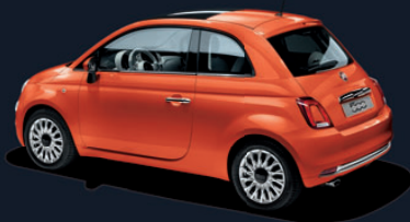
562 Sicilia Orange