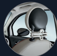
Porte veste sur appuie-tête (coloris ivoire) 50901975 - 49 €*