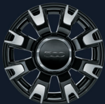
Jantes alliage 14" diamantées noir mat 50927756 - 696 €*