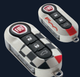
KIT DE 2 COQUES DE CLÉS SPORT : Damier et logo 500. 71805963 - 42 €*