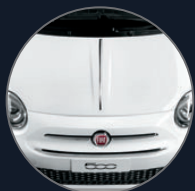
Moulure chromée sur le capot 50901691 - 85 €*