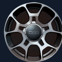
Jantes en alliage 16" Five-O-Spoke 50901669 - 899 €*