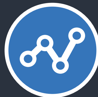
DIAGRAMME DE CONDUITE

Simple à utiliser, la batterie se recharge d'elle-même pendant les phases de freinage et hors des phases d'accélération.