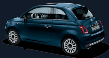
687 Epic Blue