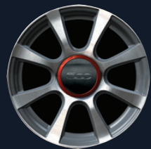
Jantes en alliage 16" By Abarth 50902469 - 899 €*