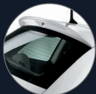
Spoiler arrière 50901672 - 189 €*