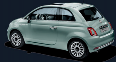
196 Rugiada Green