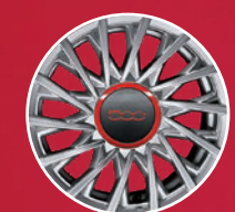
Jantes alliage 15"