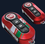
KIT DE 2 COQUES DE CLÉS ITALIE : Rouge avec drapeau italien et rouge métallisé. 71805964 - 42 €*