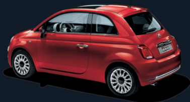
111 Pasodoble Red