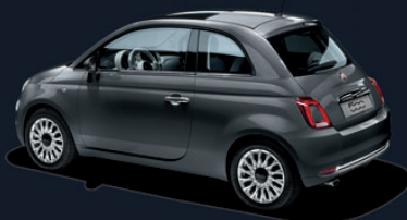
695 Electroclash Grey