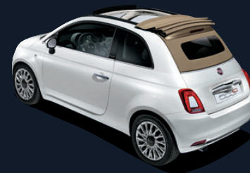
Capote beige lunaire