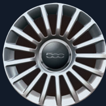
Jantes en alliage 16" Multispoke 71805883 - 899 €*