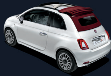
Capote rouge météorite