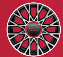
Jantes alliage 16"