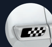
Sport noir** 50901678 - 65 €*