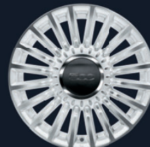
Jantes alliage 16" diamantées blanc mat 50927755 - 799 €*