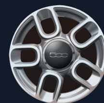
Jantes en alliage 15" Sport 71803944 - 749 €*