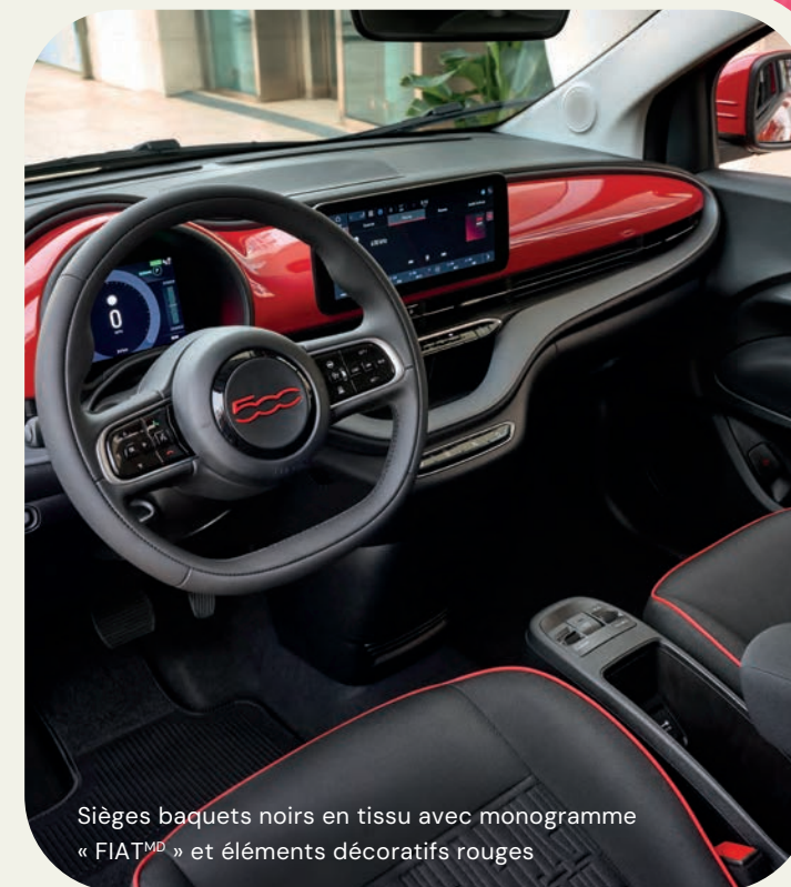
Sièges baquets noirs en tissu avec monogramme « FIAT TM » et éléments décoratifs rouges