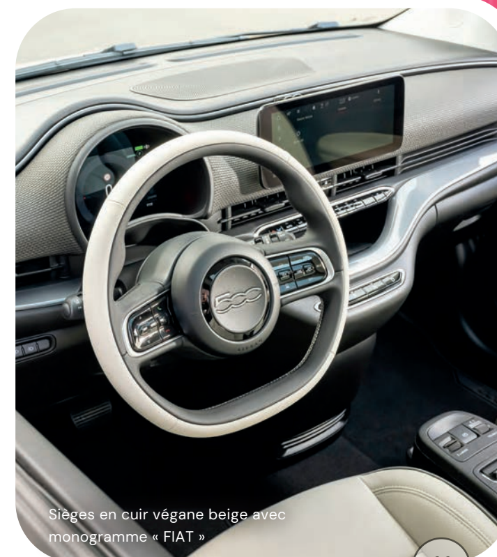
Sièges en cuir végétal beige avec monogramme « FIAT »