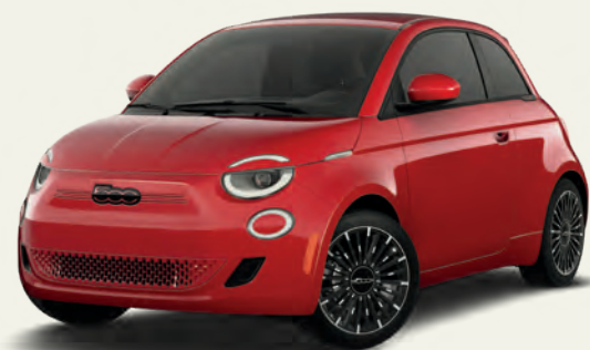
Rouge par (RED)