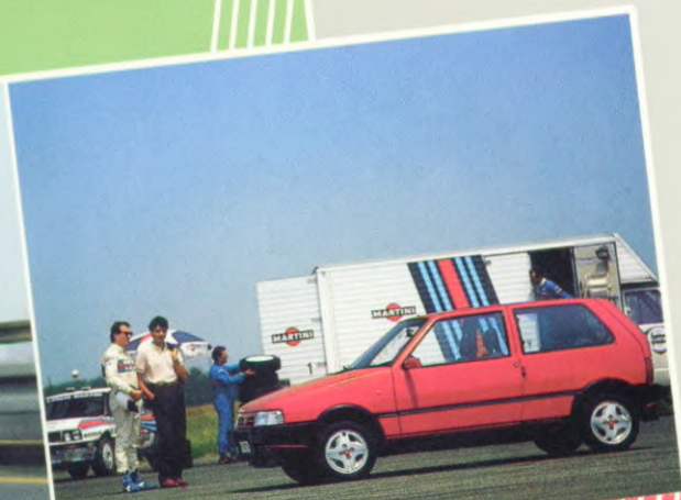
Uno Turbo i.e.

Uno 45: 3-deurs, 1000 cc Fire motor, 45 pk. Maximum snelheid 145 km/u.