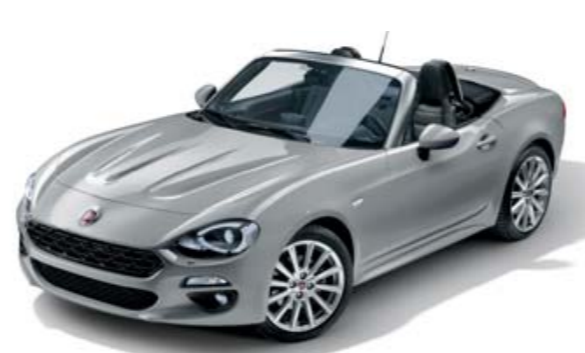
GRIS ARGENTO - PEINTURE MÉTALLISÉE