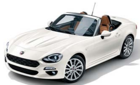
BLANC GHIACCIO - PEINTURE TRI-COUCHE