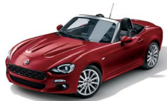
ROUGE PASSIONE - PEINTURE PASTEL - EXTRA-SÉRIE