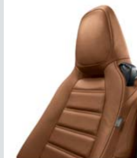
CUIR TABAC (LUSSO / LUSSO PLUS)