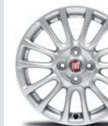
JANTES ALLIAGE 16" (124 SPIDER)