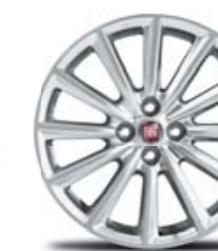
JANTES ALLIAGE 17" (LUSSO / LUSSO PLUS)