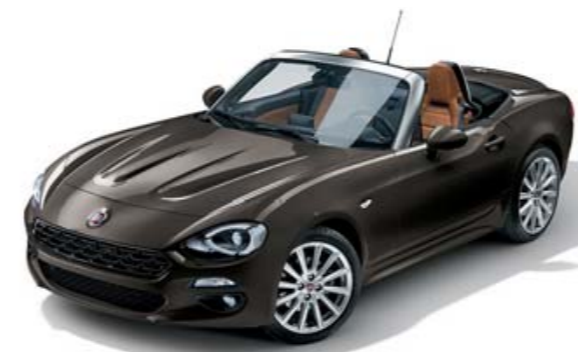
BRONZE MAGNETICO - PEINTURE MÉTALLISÉE