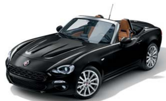
NOIR VESUVIO - PEINTURE MÉTALLISÉE