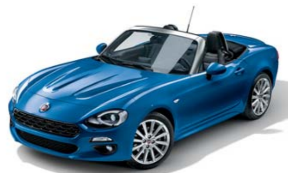
BLEU ITALIA - PEINTURE MÉTALLISÉE