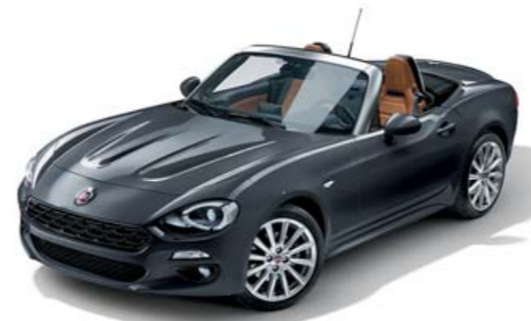
GRIS MODA - PEINTURE MÉTALLISÉE