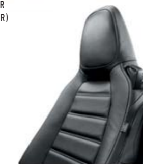
CUIR NOIR (LUSSO / LUSSO PLUS)