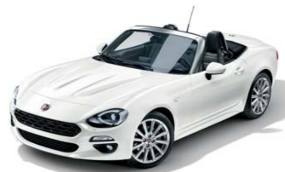
BLANC GELATO - PEINTURE PASTEL