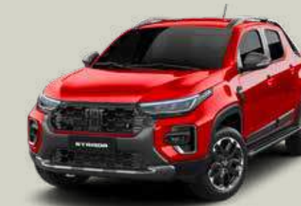
978 - Rojo Montecarlo