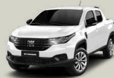
249 - Blanco Banchisa