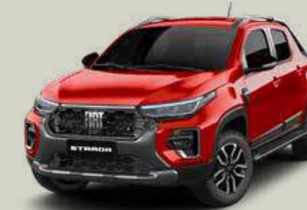
978 - Rojo Montecarlo