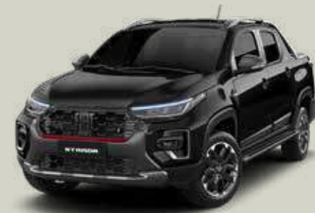
806 - Negro Vulcano