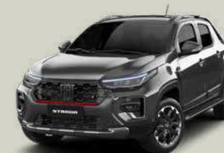
979 - Gris Silverstone