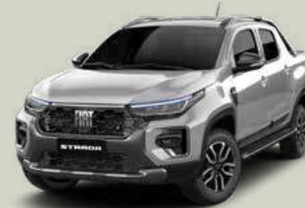
619 - Plata Bari