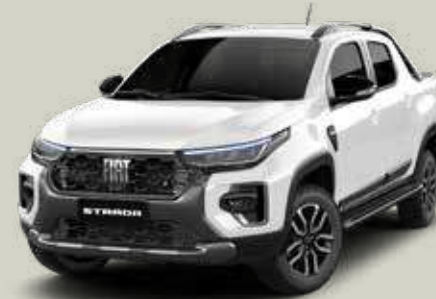
249 - Blanco Banchisa