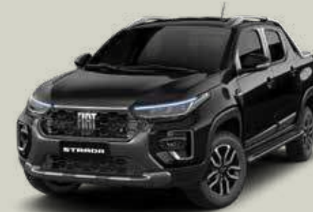
806 - Negro Vulcano