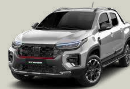
619 - Plata Bari