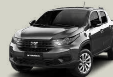
979 - Gris Silverstone