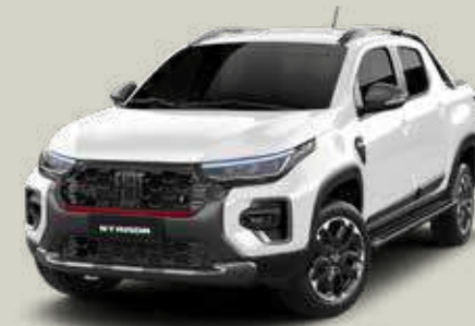
249 - Blanco Banchisa