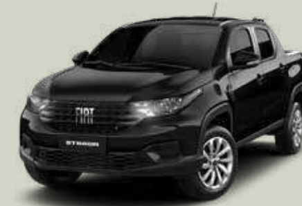
806 - Negro Vulcano