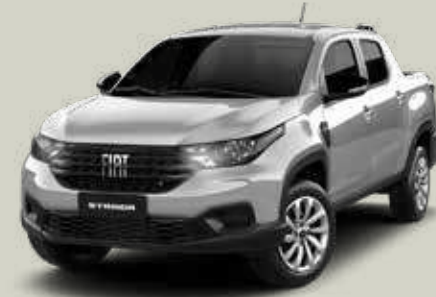
619 - Plata Bari