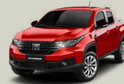
978 - Rojo Montecarlo