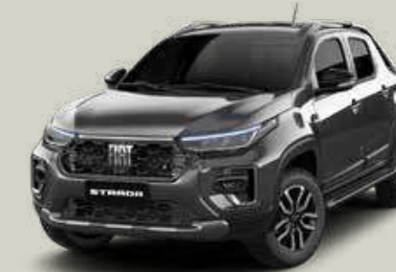
979 - Gris Silverstone