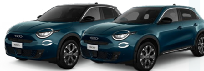
VERDE OCEANO 700€ / CON TECHO NEGRO 900€