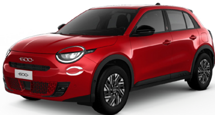
Nuevo Fiat 600e RED 54kwh 115kw (156cv)