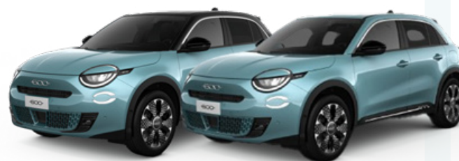
AZUL CIELO 700€ / CON TECHO NEGRO 900€