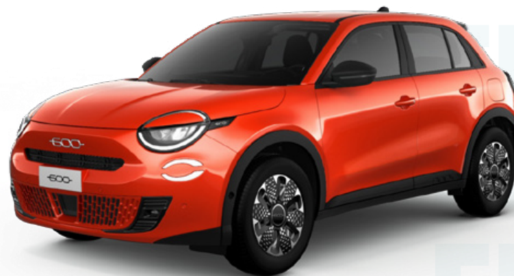
Nuevo Fiat 600e La prima 54kwh 115kw (156cv)