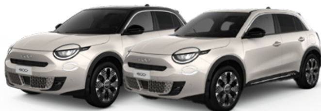
TIERRA 700€ / CON TECHO NEGRO 900€