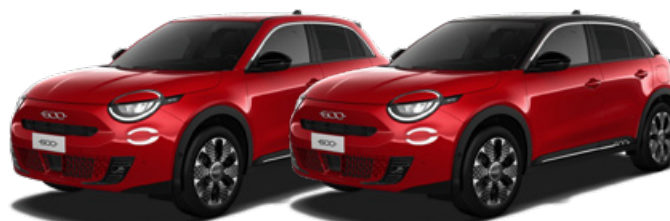
ROJO 700€ / CON TECHO NEGRO 900€