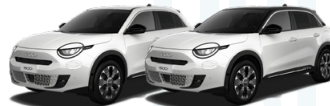
BLANCO 700€ / CON TECHO NEGRO 900€