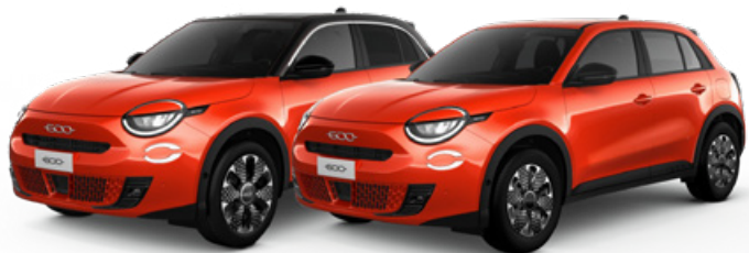
NARANJA 0€ / CON TECHO NEGRO 200€