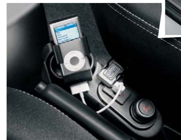
Le support iPod® vous permet de voyager au rythme de votre musique préférée (accessoire).