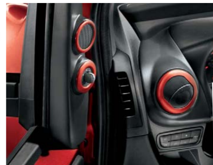
Garnitures Chrome Shadow pour un look moderne (accessoire).

Unique et inimitable, Qubo vous ressemble. Personnalisez-le grâce à une large gamme d'accessoires : tapis de sol avec logo brodé, seuils de portes, support iPod® diffuseur de parfum. Et pour vos loisirs, la gamme Lineaccessori s'étoffe : barres transversales avec porte-windsurf, porte-skis ou porte-vélos.