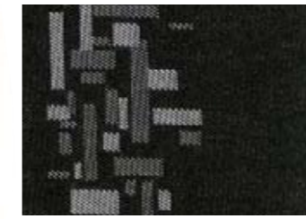
217 TISSU TANGRAM