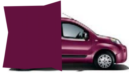
118 - FUCHSIA