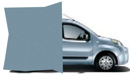
448 - BLEU AZUR