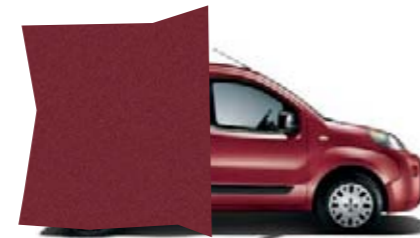
293 - ROUGE FLAMENCO