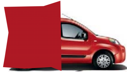
168 - ROUGE PIMPANT