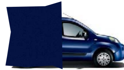
487 - BLEU NUIT