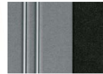
288 TISSU AXEL GRIS