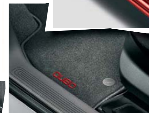
Tapis de sol en tissu avec logo brodé (accessoire).