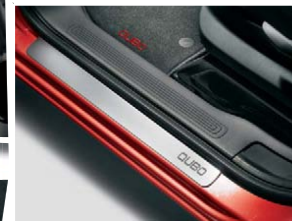
Seuil de porte tout en élégance (accessoire).