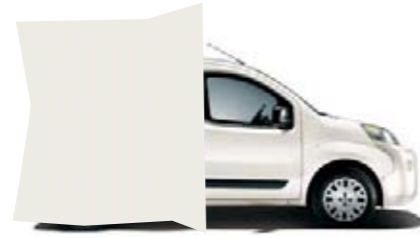
249 - BLANC