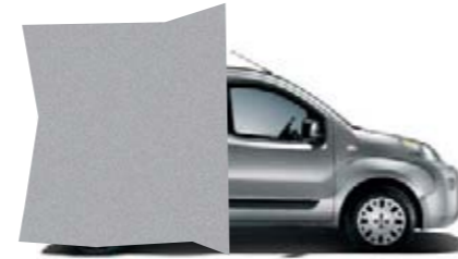
612 - GRIS MINIMAL