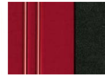
220 TISSU AXEL ROUGE