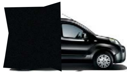
632 - NOIR GRAPHITE