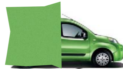
355 - VERT