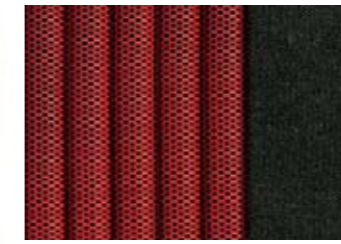
353 TISSU SAIL ROUGE