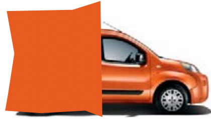
551 - FUNKY ORANGE*