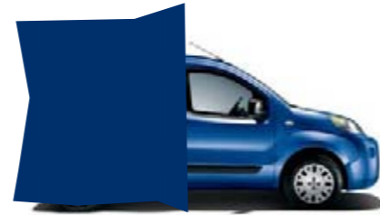
479 - BLUE LINE*