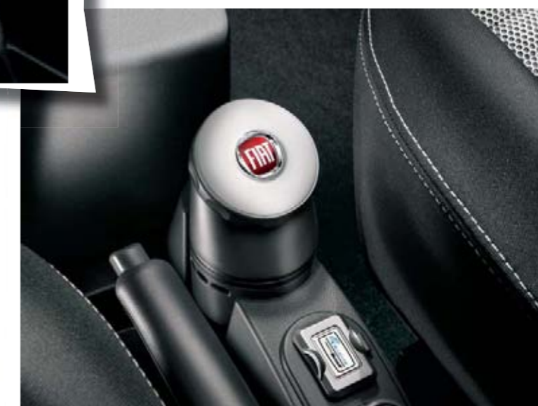
Diffuseur de parfum (accessoire).