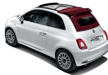
CAPOTE ROUGE MÉTÉORITE