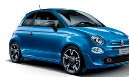
425 - EXCLUSIVE VERSION S ITALIA BLUE