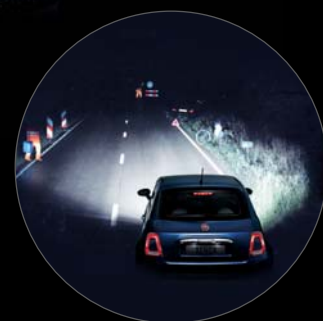
PHARES AU XÉNON

SÉCURITÉ AMÉLIORÉE GRÂCE À : UN FLUX LUMINEUX PLUS INTENSE, UN ÉCLAIRAGE SEMBLABLE À CELUI DU JOUR, UNE MEILLEURE VISIBILITÉ, UNE MEILLEURE RÉACTIVITÉ DU CONDUCTEUR.