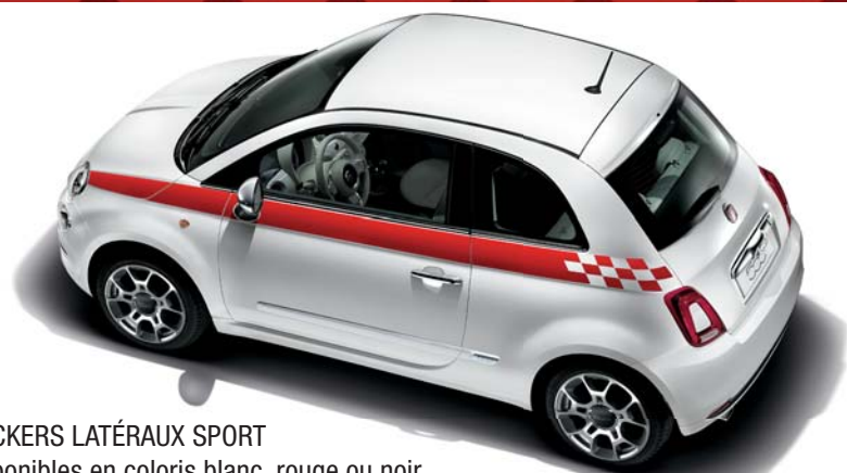
STICKERS LATÉRAUX SPORT Disponibles en coloris blanc, rouge ou noir