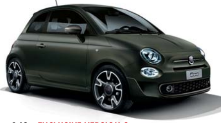
149 - EXCLUSIVE VERSION S ALPI GREEN