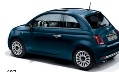
687 EPIC BLUE