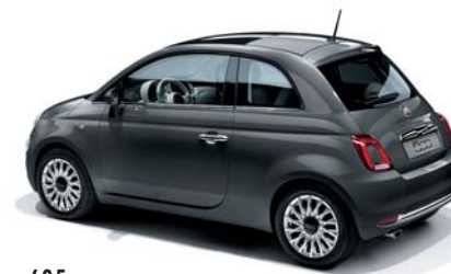
695 ELECTROCLASH GREY