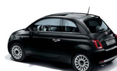
876 CROSSOVER BLACK