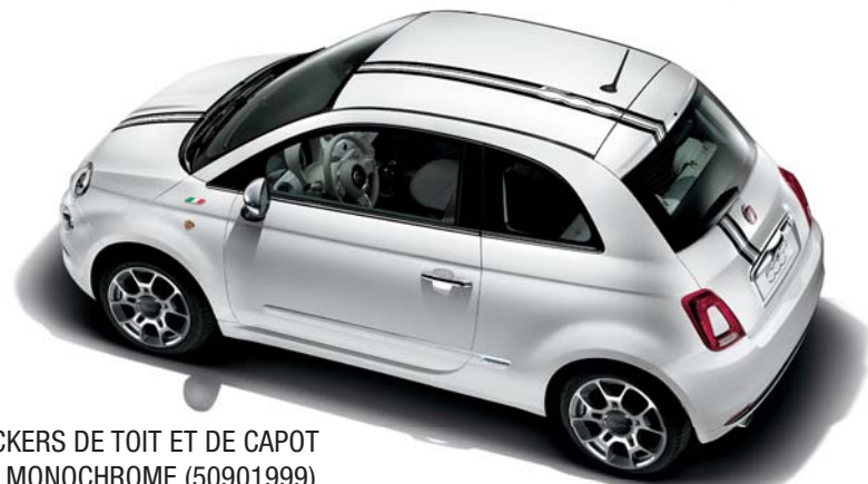
STICKERS DE TOIT ET DE CAPOT 500 MONOCHROME (50901999)