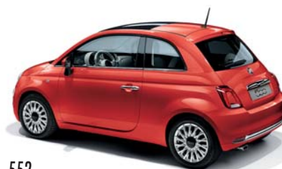
552 CORAL RED