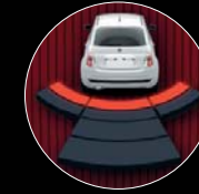
RADAR DE REcul