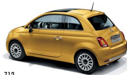
712 COUNTRYPOLITAN YELLOW