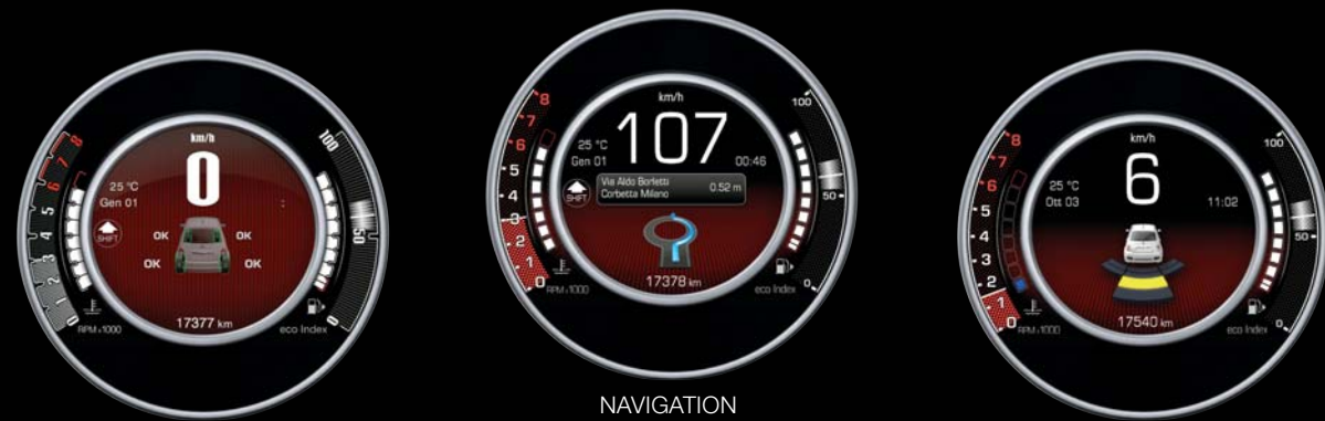
INDICATEURS DE PRESSION DES PNEUMATIQUES