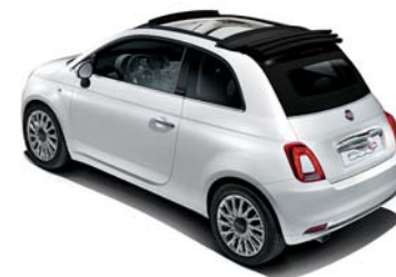
CAPOTE NOIR ÉCLIPSE