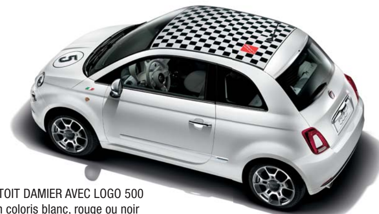
STICKER DE TOIT DAMIER AVEC LOGO 500 Disponible en coloris blanc, rouge ou noir

Stickers, coques de clés, badges latéraux, jantes alliage et même pochettes maquillage : toute une gamme d'accessoires à votre disposition pour renforcer le look de votre Fiat 500 et la rendre véritablement unique.