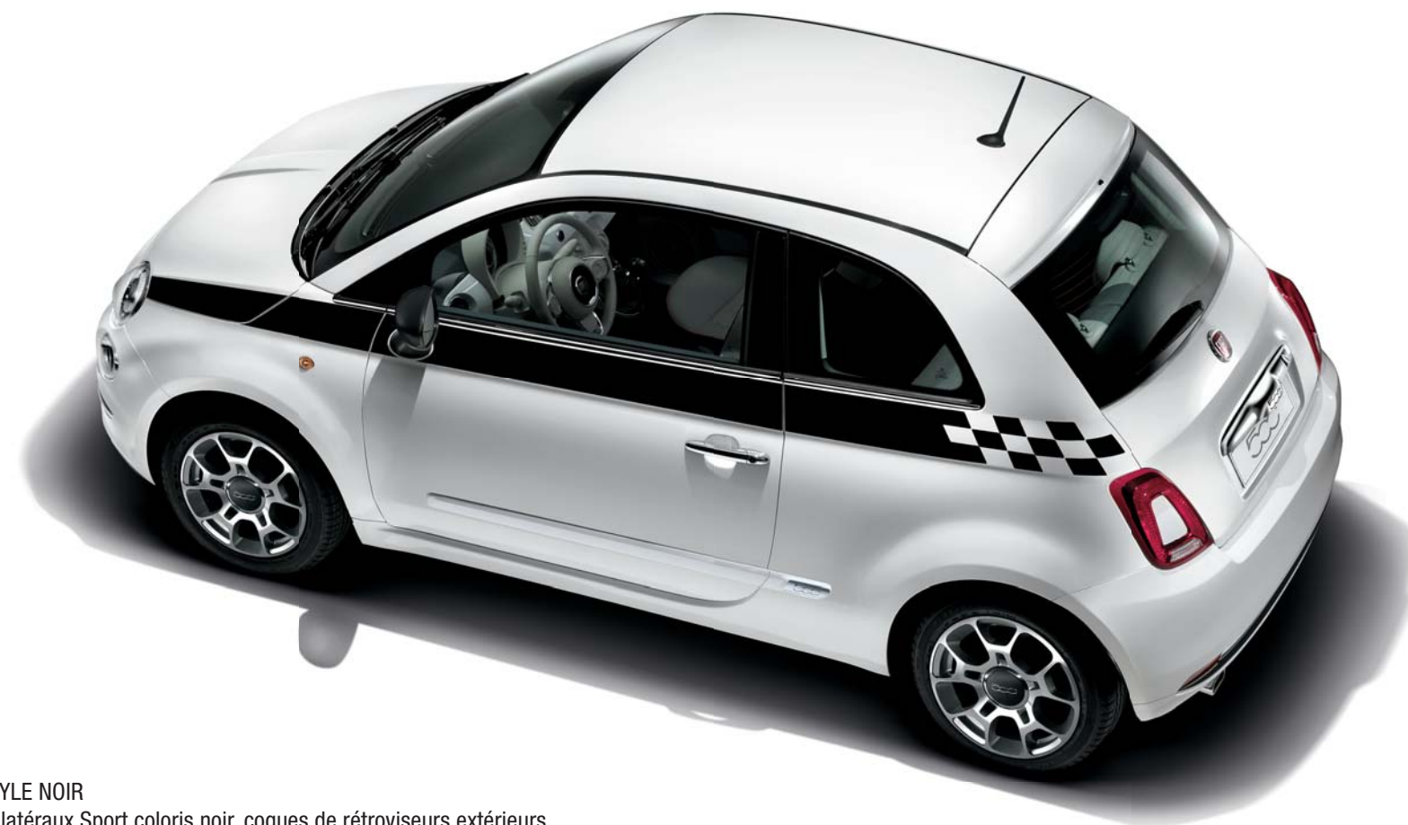
PACK STYLE NOIR Stickers latéraux Sport coloris noir, coques de rétroviseurs extérieurs coloris noir et kit de 2 coques de clés Sport (71807472)