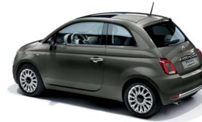
372 GROOVE METAL GREY