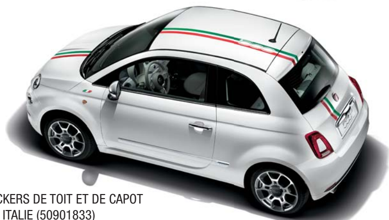
STICKERS DE TOIT ET DE CAPOT 500 ITALIE (50901833)