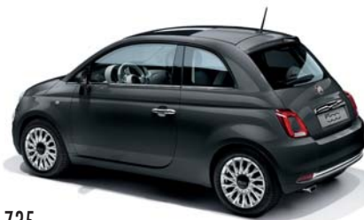
735 TECH-HOUSE GREY