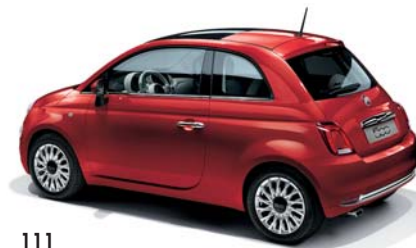
111 PASODOBLE RED