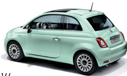
166 MINT GREEN