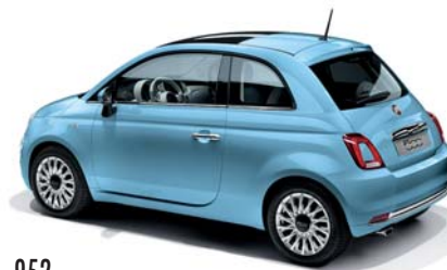
952 SOUL BLUE