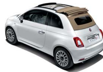
CAPOTE BEIGE LUNAIRE

500S Cabriolet seulement disponible avec capote noire