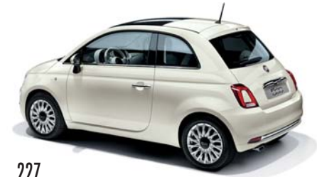
227 ICE WHITE