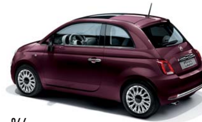
866 OPERA BORDEAUX