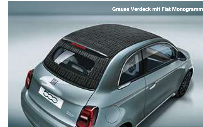
Graues Verdeck mit Fiat Monogramm