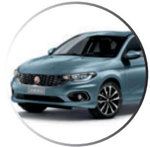
448 Bleu Canalgrande (2) Peinture métallisée