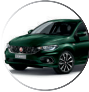
651 Vert Toscana Peinture métallisée