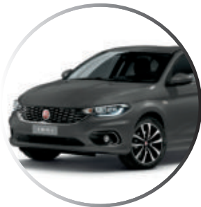
706 Gris mat (1) Peinture mate