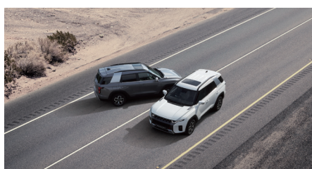
Multi Collision Brake (MCB)