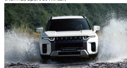
Profondeur allant jusqu'à 300 millimètres (jusqu'à 30 km/h)