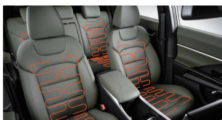
Sièges avant et arrière chauffants