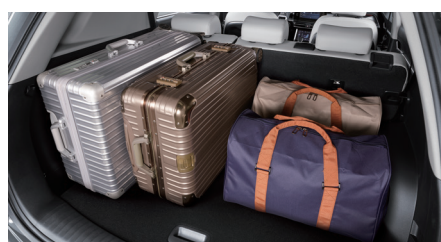
Volume de chargement standard de 703 litres