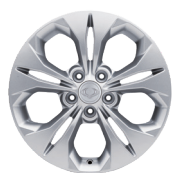
17" en aluminium