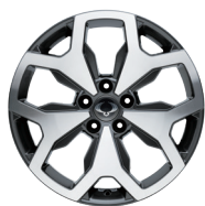
18" en aluminium Diamond Cutt