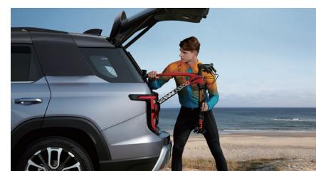
Hayon arrière à commande électrique

Inspiré de l'esprit du site magique de Torres del Paine, au Chili, le Torres a été conçu pour vous conduire n'importe où, en toute sécurité. Il vous invite à aller toujours plus haut, toujours plus loin et à explorer de nouveaux horizons.