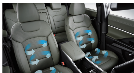
Sièges avant ventilés