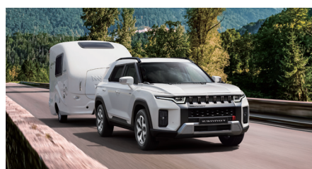
Capacité de remorquage jusqu'à 1500 kg