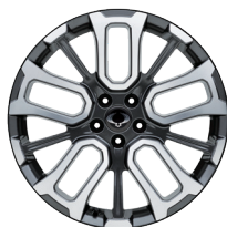
20" en aluminium Diamond Cut