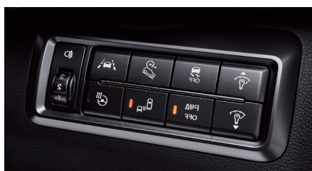
Console de commandes