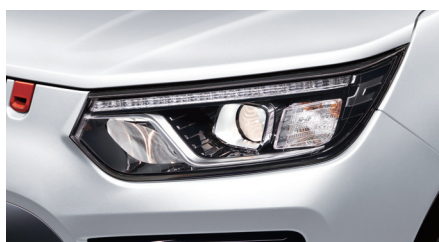
Blocs optiques à projecteurs