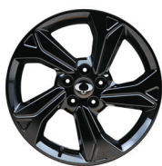
Jantes New Black Diamond Cut de