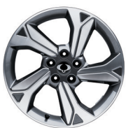
Jantes New Diamond Cut de