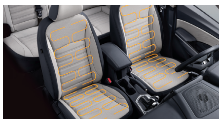
Sièges chauffants à l'avant

Le nouveau Tivoli est équipé d'un moteur 1.5 GDI turbo, qui garantit un couple généreux à bas régime et des accélérations franches pour un plaisir de conduire renforcé. Vous avez le choix entre une boîte manuelle 6 vitesses ou une transmission automatique AISIN à 6 rapports, avec trois modes de conduite: Normal, Sport et Winter. Grâce à une dotation complète de systèmes de sécurité intégrés, vous pouvez conduire avec une sérénité inégalée, que ce soit en ville, pour vos trajets quotidiens ou lors de vos longs déplacements à travers le pays, et quelles que soient les conditions de route.