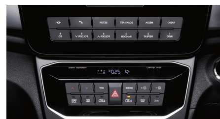
Conditionnement d'air manuel