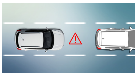
Avertissement de collision frontale (FCW)