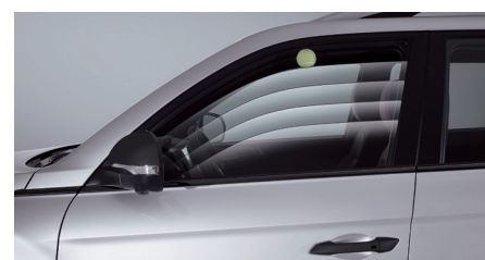
Vitres électriques sécurisées