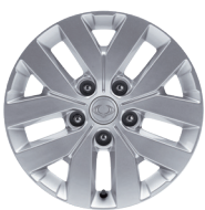
17" en aluminium