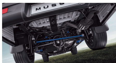
Suspension arrière multibras