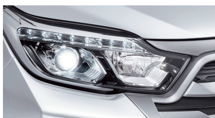
Phare à haute intensité