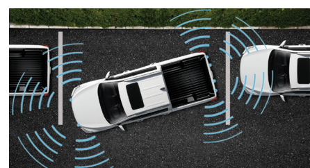
Aide au stationnement