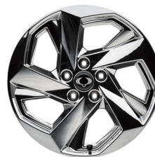
20" en aluminium