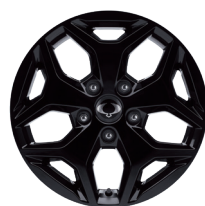
18" jantes noires en aluminium