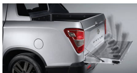
Hayon de benne renforcé