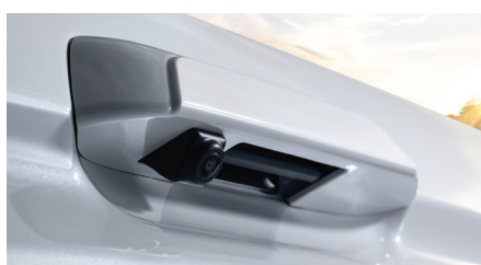
Caméra de recul