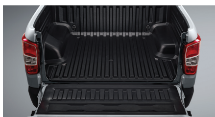
Benne ouverte (volume de chargement de 1011 L)