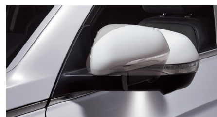
Rétroviseurs extérieurs rabattables avec clignotants

L'arrière du Musso est instantanément reconnaissable par son design caractéristique et ses feux disposés en coins. Le look robuste du bouclier avant se prolonge sur les flancs jusqu'au bouclier arrière. Les réflecteurs arrière assurent un surcroît de visibilité et donc de sécurité.