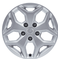
18" en aluminium