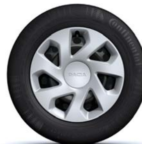
ENJOLIVEUR 15" GROOMY*