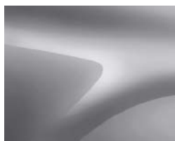
GRIS HIGHLAND (2)