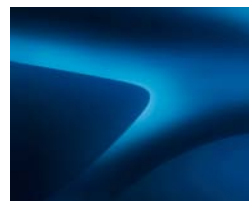
BLEU AZURITE** (2)