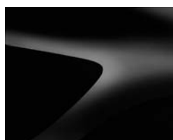
NOIR NACRÉ (2)