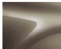
BEIGE DUNE (2)