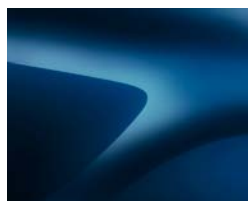
BLEU COSMOS (2)