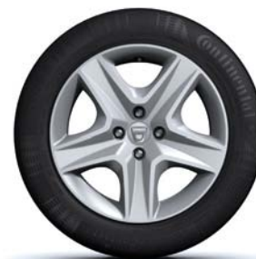
JANTES DESIGN 16" OASIS*