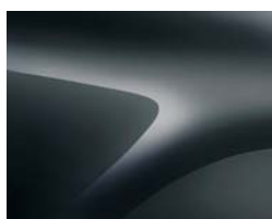
GRIS COMÈTE (2)