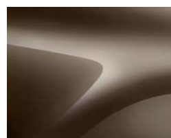
BRUN VISON (2)