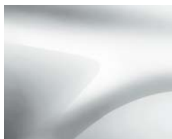
BLANC GLACIER (1)