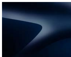
BLEU NAVY* (1)