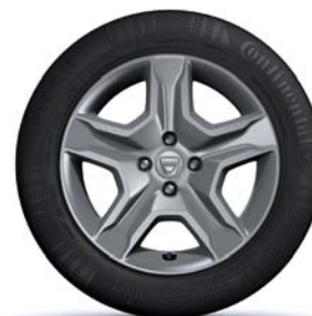
JANTES DESIGN 16" BAYADÈRE DARK METAL**