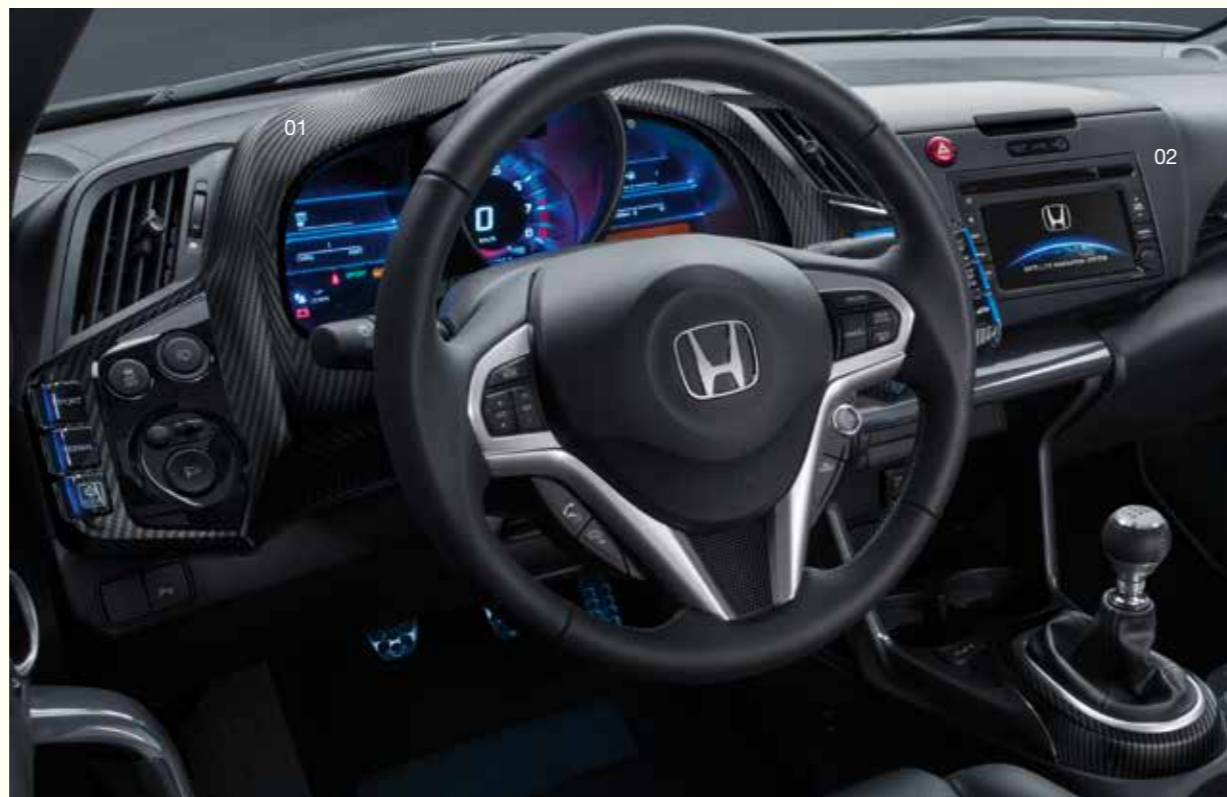
01. Insert de tableau de bord effet carbone 02. Système de navigation par satellite avec cartographie SD

Nos ingénieurs ont passé beaucoup de temps à concevoir l'intérieur du CR-Z. A votre tour maintenant.