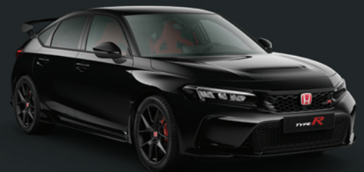
NOIR CRISTAL NACRÉ