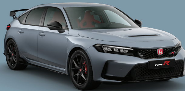
GRIS SONIC NACRÉ