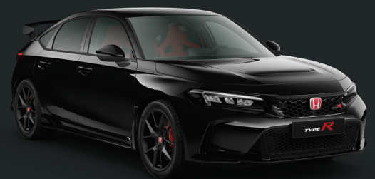
NOIR CRISTAL NACRÉ