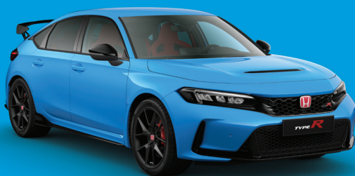
BLEU RACING NACRÉ