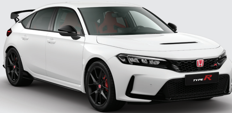
BLANC CHAMPIONSHIP PREMIUM