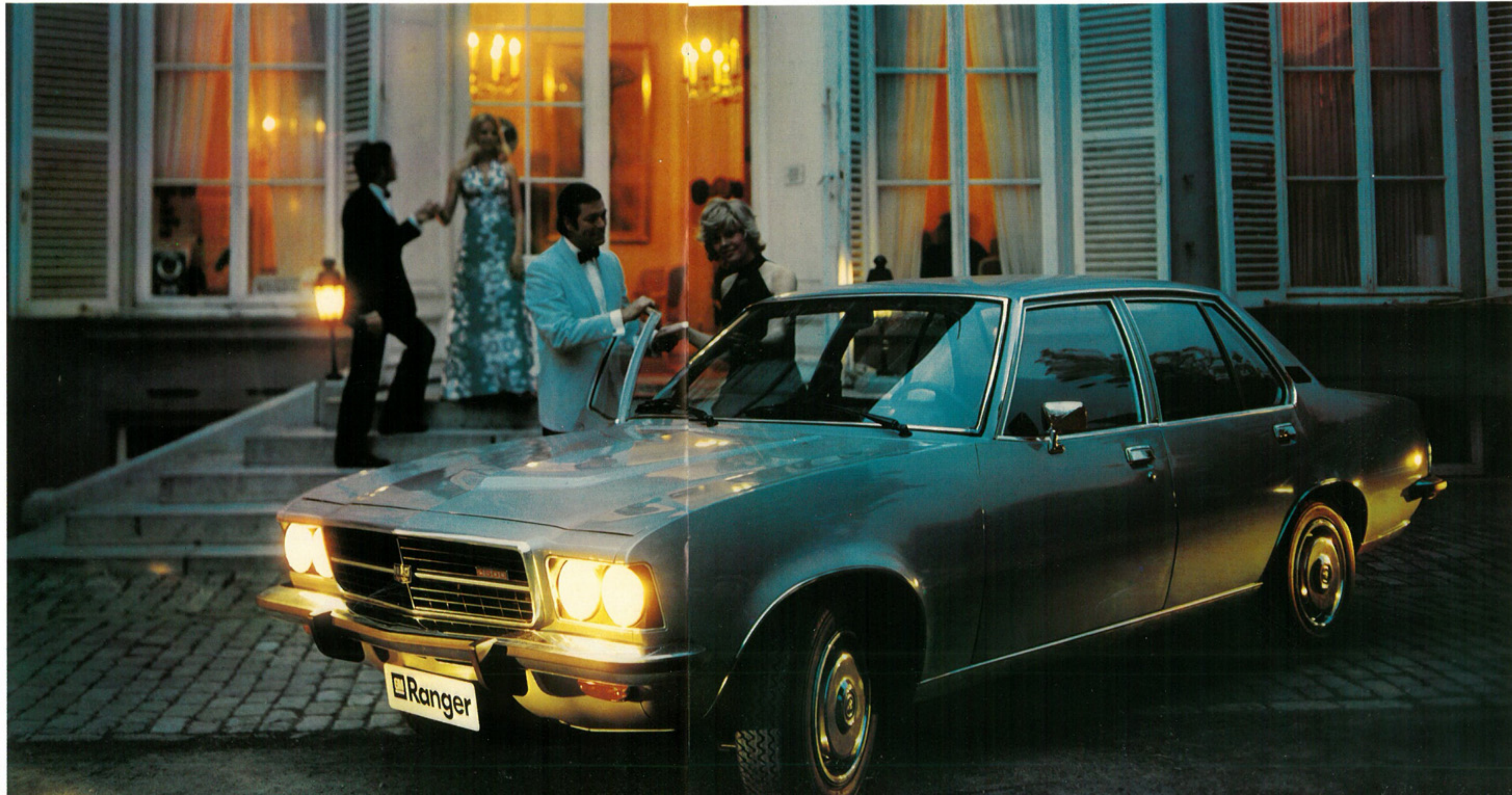
Berline Ranger 2500 4 portes à moteur 6 cylindres «2500 S» et transmission automatique GM.

Maîtrise de la puissance, luxe du confort et raffinement de la finition, voilà comment la Berline Ranger 2500 affirme sa personnalité de routière de grande lignée.