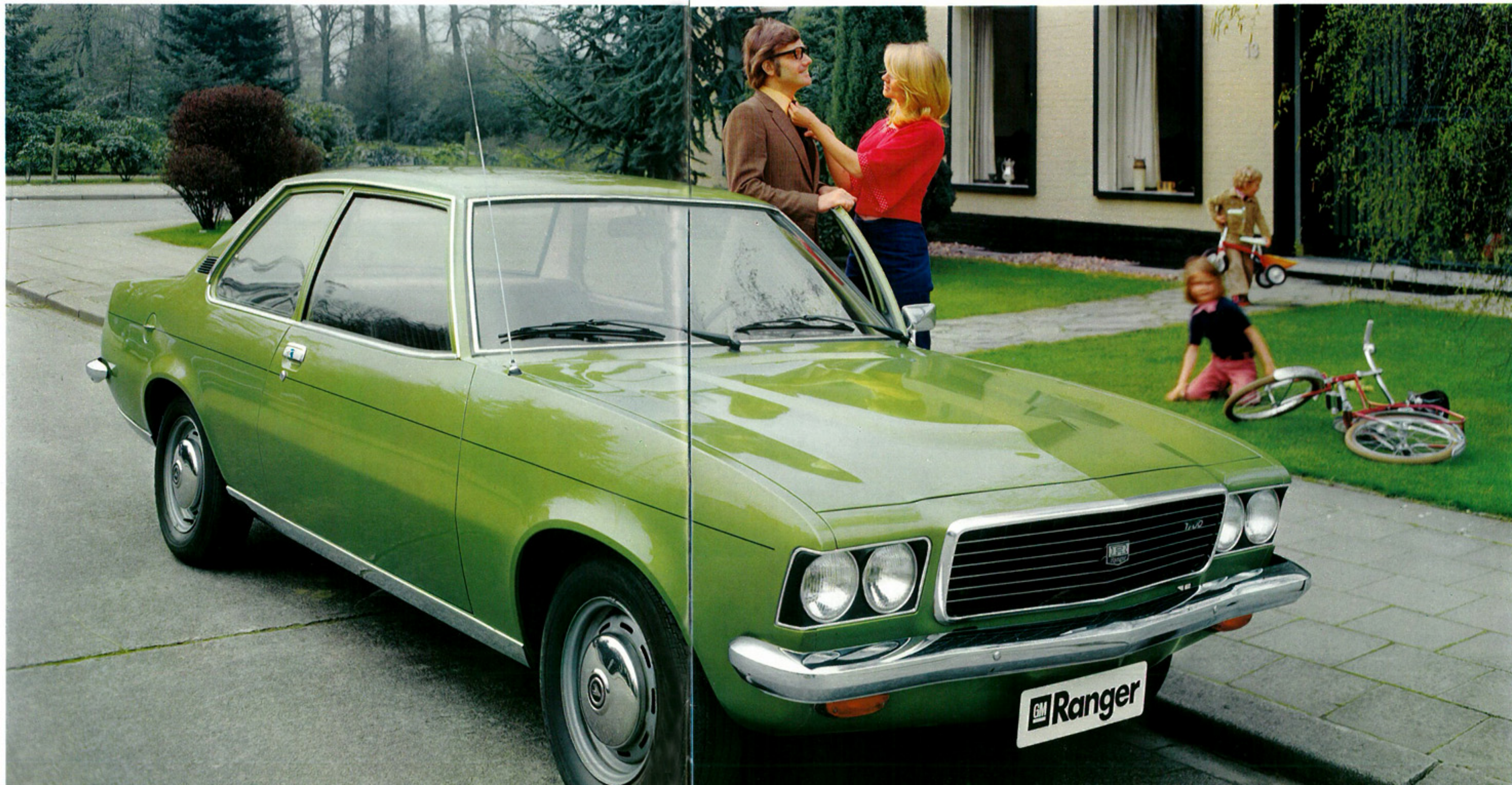
Ci-contre, la Ranger 1900, 2 portes à moteur «1900 SH». En Suisse ce modèle est équipé d'enjoliveurs de roue Deluxe (voir double page suivante). La radio et l'antenne ne font pas partie de l'équipement de série.

Un autre avantage propre à la nouvelle Ranger est la surface vitrée particulièrement grande. En ville, vous apercevez facilement tout ce qui se passe autour de vous. Egalement en hiver, car la lunette arrière est dégivrée électriquement : la visibilité vers l'arrière est toujours parfaitement dégagée. Et lors des randonnées ou voyages de vacances, vous jouissez d'une vue panoramique sur les paysages traversés, que vous découvrirez comme jamais vous ne l'avez fait auparavant.