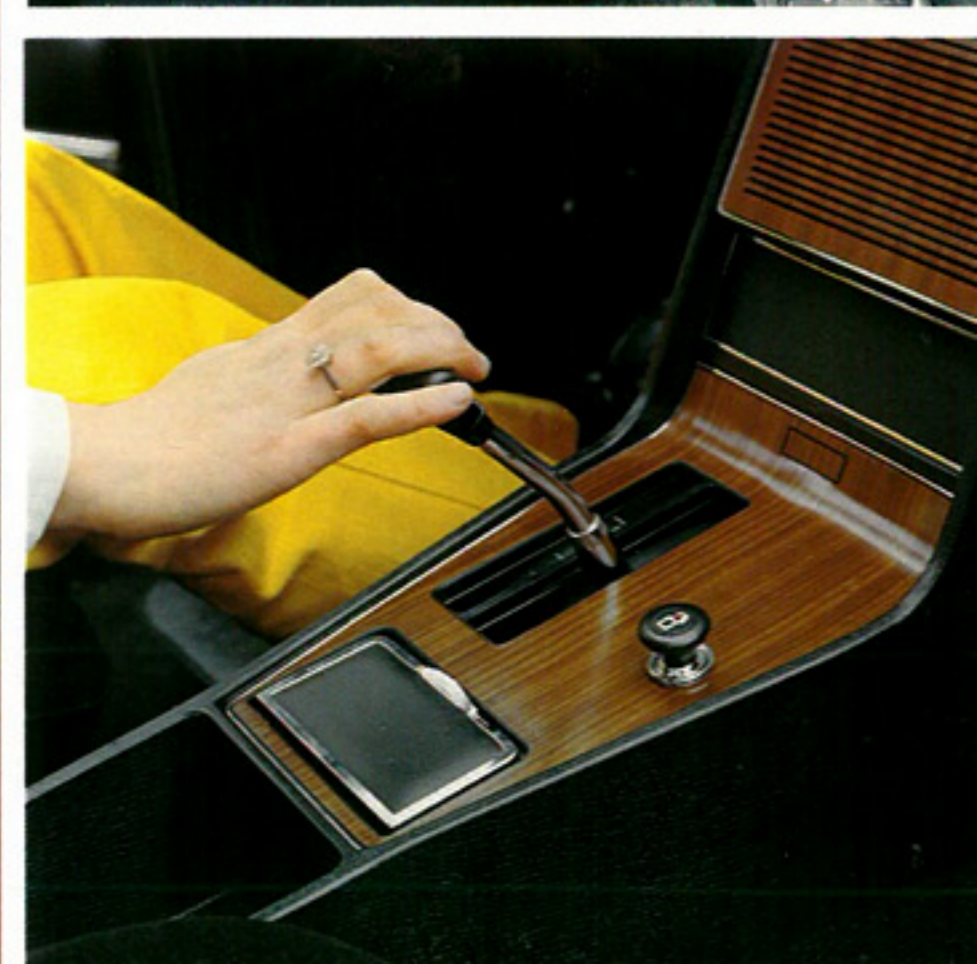
A gauche : l'intérieur de la Ranger 2500, à droite celui du Coupé 2500 GTS, en bas à droite le levier de la GM-Automatic.