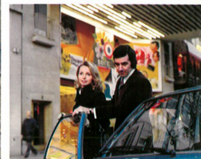
Berline Ranger 1900 2 portes à moteur «1900 SH», livrable avec boîte à quatre vitesses ou transmission automatique GM.