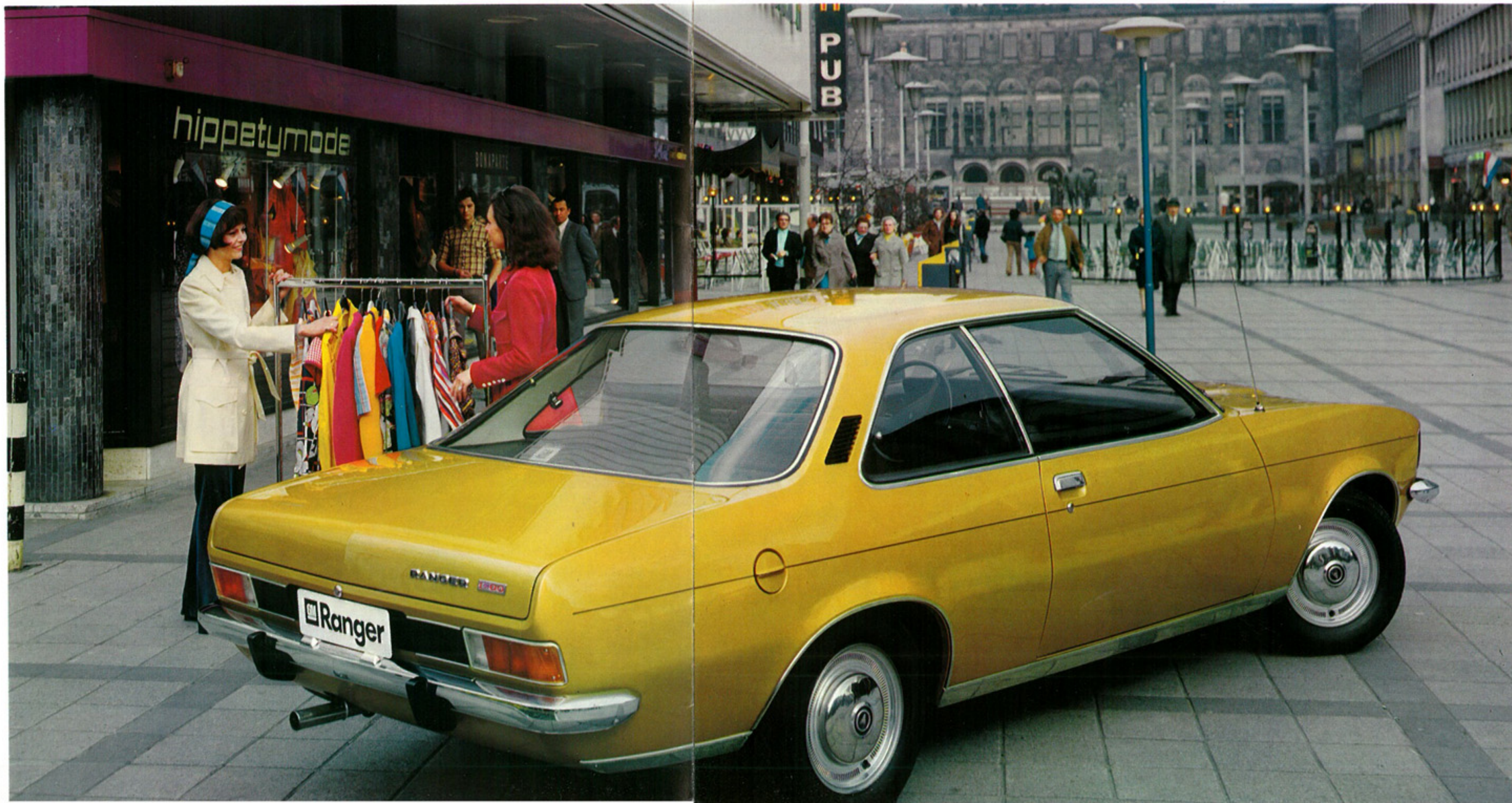
Coupé Ranger 1900, avec moteur «1900 SH».

Le Coupé Ranger 1900 est une voiture séduisante, qu'il suffit de connaître pour aimer.