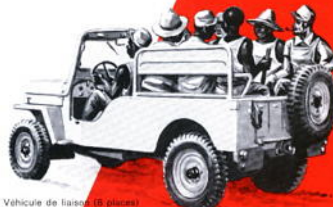
Véhicule de liaison (8 places)