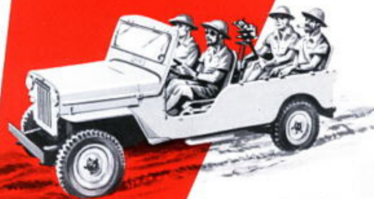
Transport mixte (passagers-marchandises)

Le capotage* de la Jeep est parfaitement étanche. Les portières, les cotés et le panneau arrière — tous en toile et mica sur armature métallique en tube — sont amovibles. Le montage ou le démontage de l'ensemble s'effectue rapidement, de même que la transformation du capotage complet en capotage cabine.