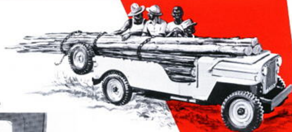
Transport mixte (passagers-marchandises)

Le capotage* de la Jeep est parfaitement étanche. Les portières, les cotés et le panneau arrière — tous en toile et mica sur armature métallique en tube — sont amovibles. Le montage ou le démontage de l'ensemble s'effectue rapidement, de même que la transformation du capotage complet en capotage cabine.