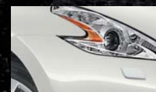
Blanc Lunaire QAB / (M)