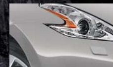
Gris Argent K23 / (M)