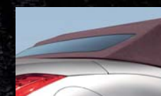
Capote Bordeaux (indisponible avec la couleur Vibrant Red)