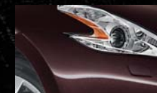
Black Rose NAG / (M)