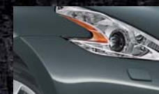
Gris Squale KAD / (M)