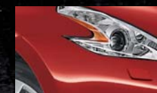
Vibrant Red A54 / (O)