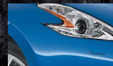
Bleu Royal RAE / (M)