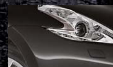
Noir Intense G41 / (M)