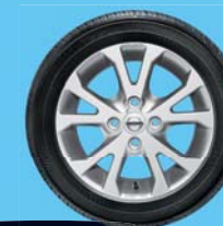
Demandez la brochure d'accessoires spécifiques Pixo