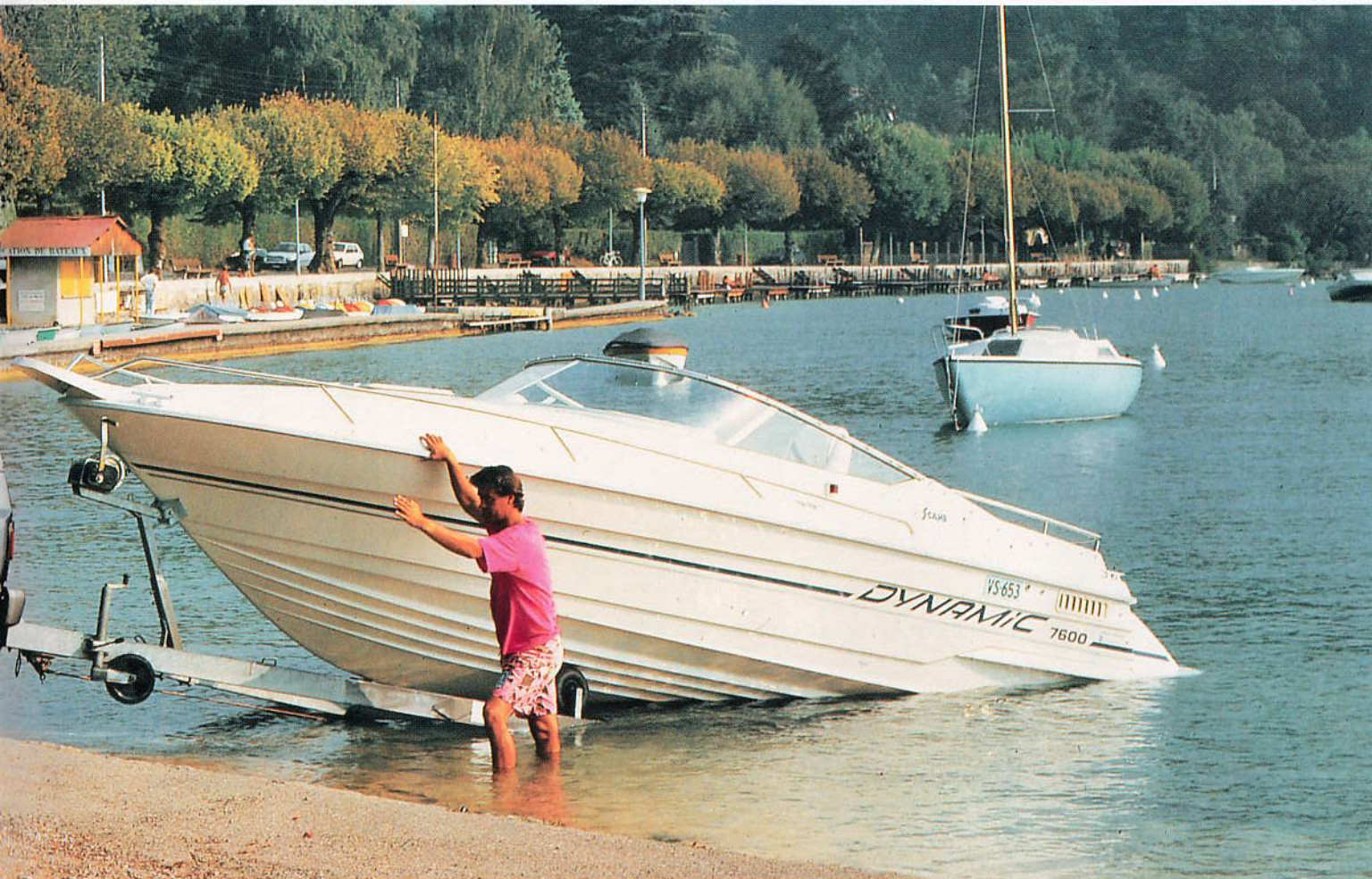
PATROL GR 4,2l Injection

Conçu pour les Raids les plus audacieux, le PATROL GR bénéficie d'une motricité sans faille grâce à une nouvelle boîte de transfert à chaîne, à gamme de rapports longs et courts.