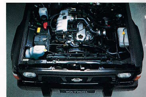
Moteur 4,2l Injection

Le Turbo compresseur refroidit par eau, agit dès les bas régimes.