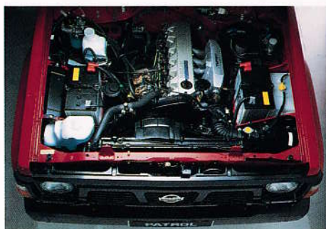
Moteur 2,8l Turbo Diesel