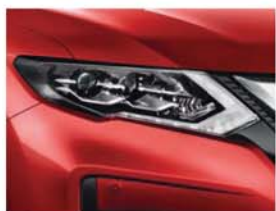
Rouge Mercure - M - NBF