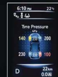
PRESSION DES PNEUS