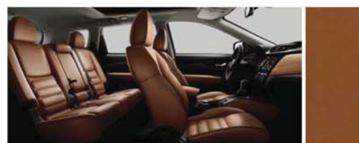
CUIR MATELASSÉ COULEUR HAVANE