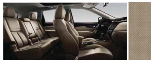
CUIR AVEC SURPIQUÂGE BEIGE