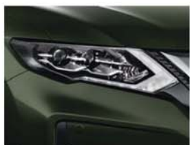
Vert Maquis - M - EAN