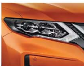
Orange Colorado - M - EBB