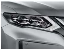
Gris Argent - M - K23