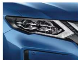
Bleu Astral - M - RAW