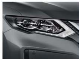
Gris Squalo - M - KAD