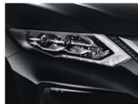
Noir Intense - M - G41