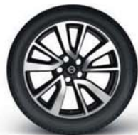
Jantes alliage 19"