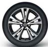
Jantes alliage 18"