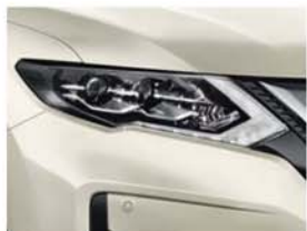
Blanc Lunaire - M - QAB