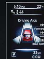
AIDES À LA CONDUITE