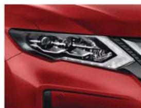
Rouge Rubis - O - AX6