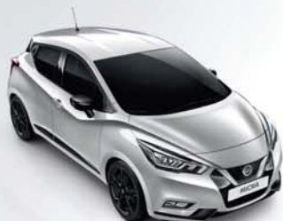
GRIS PLATINE - ZBD PACK EXTÉRIEUR : NOIR BRILLANT SELLERIE STANDARD