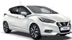
Blanc Perle -S- QNC