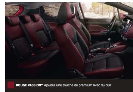
ROUGE PASSION** Ajoutez une touche de premium avec du cuir