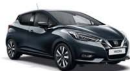
Gris Acier -M- KPN