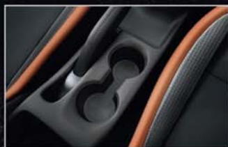
Trois porte-gobelets idéalement placés.

La capacité de chargement de la Nissan MICRA est étonnante. Baissez les sièges arrière pour charger des objets longs ou encombrants et utilisez tous les espaces de rangement pour vos affaires personnelles. Vous trouverez une large boîte à gants, des espaces sur les contre-portes à l'avant pouvant contenir des bouteilles de 1,5L, une poche aumônière au dos du siège passager, un espace pour déposer vos clés ou votre portable avec une prise USB / 12V, et enfin trois porte-gobelets dont deux entre les sièges avant.