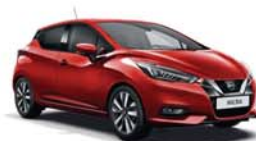
Rouge Volcano -S- NBD