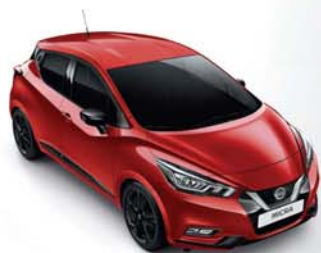
ROUGE VOLCANO - NBD PACK EXTÉRIEUR : NOIR BRILLANT SELLERIE STANDARD