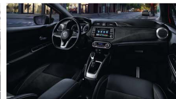
Sellerie mi-Alcantara® mi-TEP (Tissu Enduit) N-SPORT