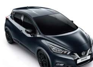
GRIS ACIER - KPN PACK EXTÉRIEUR : NOIR BRILLANT SELLERIE STANDARD

*Disponible en option sur N-CONNECTA et TEKNA **Disponible en option sur TEKNA