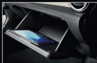
Une boîte à gants d'une capacité de 10L.