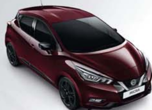
ROUGE PASSION - NBT PACK EXTÉRIEUR : NOIR BRILLANT SELLERIE STANDARD