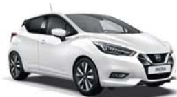
Blanc Opaque -O- ZY2