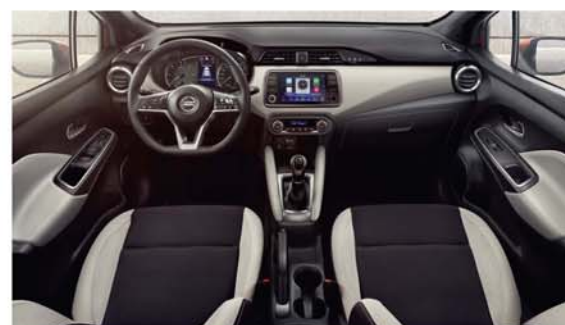
Sellerie Tissu sport avec inserts Gris et surpiqûres TEKNA