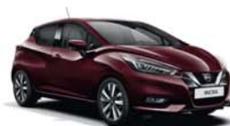
Rouge Passion -S- NBT