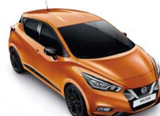
ORANGE RACING - EBF PACK EXTÉRIEUR : NOIR BRILLANT PACK INTÉRIEUR : ORANGE RACING