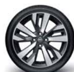
Alliage 17" avec fond noir