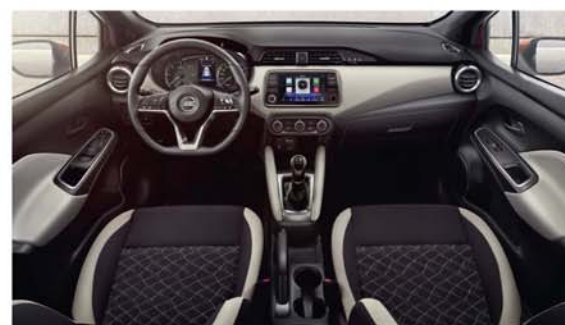
Sellerie bi-ton Noir/Gris N-CONNECTA