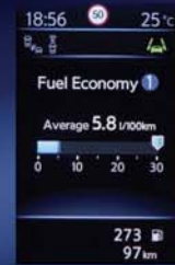
INFORMATIONS DE CONDUITE EN TEMPS RÉEL