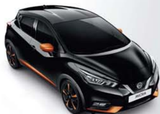
NOIR OBSCUR - GNE PACK EXTÉRIEUR : ORANGE RACING PACK INTÉRIEUR : ORANGE RACING