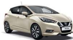
Ivoire -O- D16