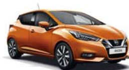
Orange Racing -M- EBF