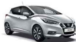
Gris Platine -M- ZBD