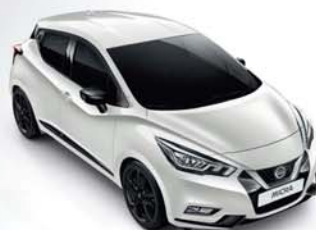
BLANC PERLE - QNC PACK EXTÉRIEUR : NOIR BRILLANT SELLERIE STANDARD