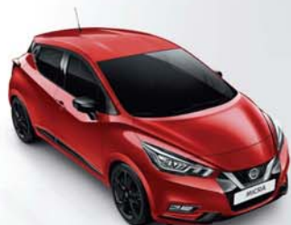
ROUGE VOLCANO - NBD PACK EXTÉRIEUR : NOIR BRILLANT PACK INTÉRIEUR : CUIR ROUGE PASSION (TEKNA UNIQUEMENT)