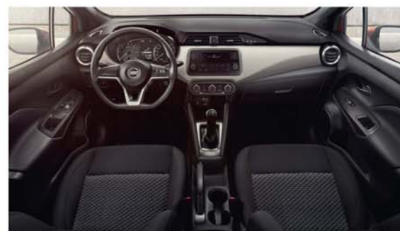
Sellerie Tissu Noir VISIA PACK