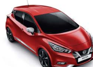
ROUGE VOLCANO - NBD PACK EXTÉRIEUR : CHROME MAT SELLERIE STANDARD