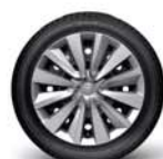
Acier 16" (avec enjoliveurs)