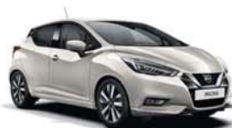
Gris Satiné -M- KNV