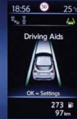
AIDES À LA CONDUITE