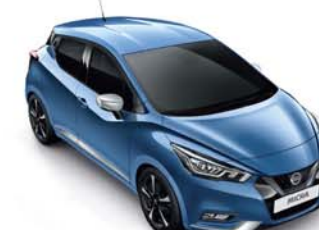
BLEU ELECTRIQUE - RQG PACK EXTÉRIEUR : CHROME MAT SELLERIE STANDARD