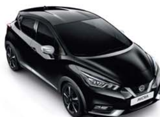
NOIR OBSCUR - GNE PACK EXTÉRIEUR : CHROME MAT SELLERIE STANDARD