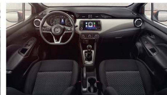
Sellerie Tissu Noir ACENTA