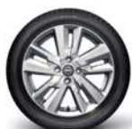
Alliage 16" sans fond noir