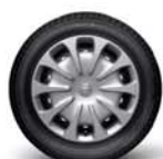
Acier 15" (avec enjoliveurs)