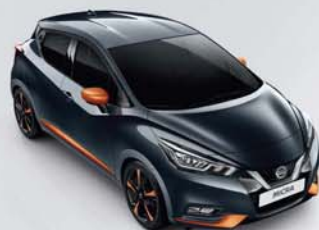
GRIS ACIER - KPN PACK EXTÉRIEUR : ORANGE RACING PACK INTÉRIEUR : ORANGE RACING