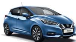
Bleu Électrique -M- RQG