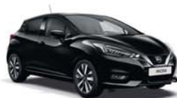
Noir Obscur -M- GNE